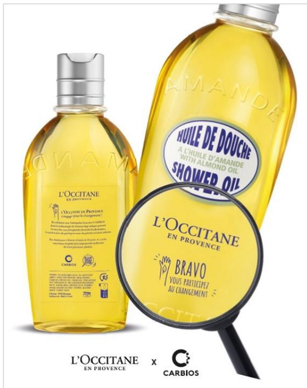
Figure 1 : Le premier flacon de L'OCCITANE en Provence en PET issu à 100% du recyclage enzymatique grâce à la technologie de CARBIOS

Clermont-Ferrand et Manosque (France), le jeudi 30 mai 2024 (18h CEST). CARBIOS , (Euronext Growth Paris : ALCRB), pionnière dans le développement et l'industrialisation de technologies biologiques pour réinventer le cycle de vie des plastiques et des textiles, et L'OCCITANE en Provence , une marque internationale de cosmétiques à base d'ingrédients naturels et biologiques, partenaire de longue date de CARBIOS, présentent un flacon d'huile de douche de la gamme Amande en PET transparent issu entièrement du recyclage enzymatique. En collaboration avec le transformateur Pinard Beauty Pack , ce flacon est la concrétisation d'une volonté commune de construire une filière européenne performante pour accélérer la transition vers une économie circulaire des plastiques et répondre aux engagements des marques pour des solutions d'emballages plus respectueuses de l'environnement. Le flacon sera présenté au Stand D02 de CARBIOS à l'Édition Spéciale by LuxePack, le salon dédié aux emballages premium durables, qui se tiendra les 4 et 5 Juin 2024 au Carreau du Temple à Paris.