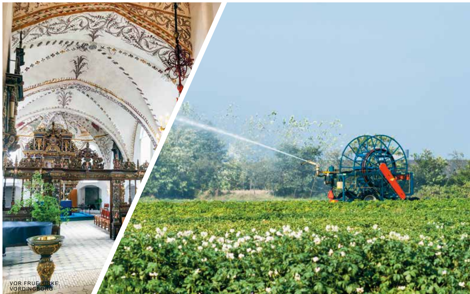
VOR FRUE KIRKE, VORDINGBORG