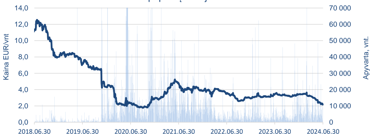
AB Novaturas akcijų kaina ir apyvarta Nasdaq Vilnius vertybinių popierių biržoje

2024 m. birželio 30 d. Bendrovės rinkos kapitalizacija buvo 17,02 mln. Eurų – per antrąjį metų ketvirtį sumažėjo 32 proc.