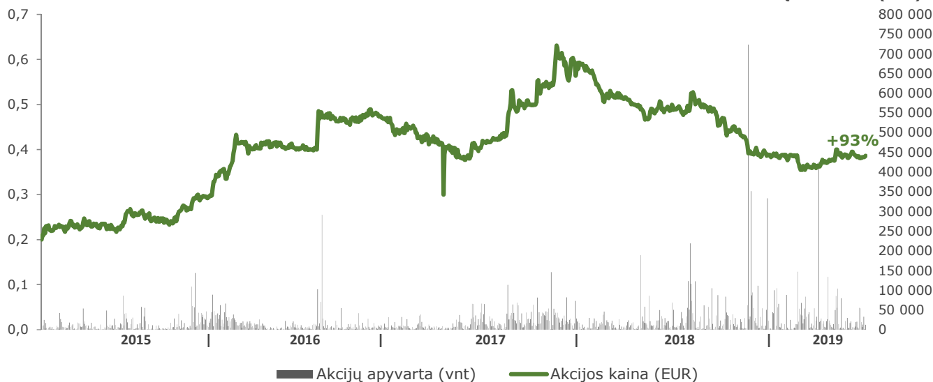
AKCIJŲ APYVARTA (VNT)