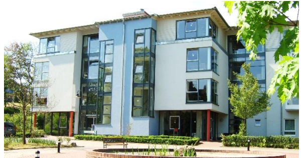
Azurit Seniorenzentrum Bad Köstritz - Thuringe