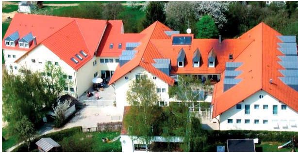
Azurit Seniorenzentrum Laaberg - Bavière

Le 1 avril 2021 – avant ouverture des marchés Sous embargo jusqu'à 7h30 CET