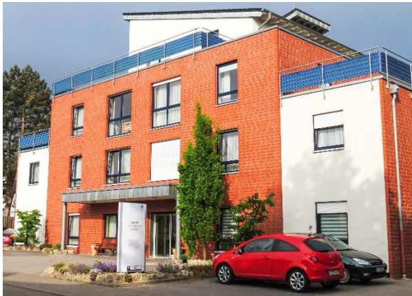
Azurit Seniorenzentrum Grünstadt - Rhénanie-Palatinat

Les années de construction ou de redéveloppement des immeubles du portefeuille se situent entre les années 1990 et 2017. Le portefeuille bénéficie d'un bon état technique général grâce à son niveau d'entretien élevé et à plusieurs projets de rénovation, d'extension, de redéveloppement et de durabilité qui ont eu lieu au fil des ans. Ce portefeuille offre un bon potentiel à long terme compte tenu du concept et des plans des bâtiments.