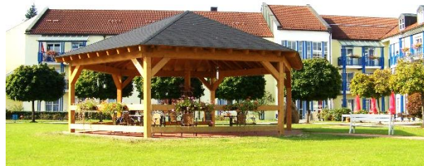
Azurit Seniorenzentrum Abundus – Bavière