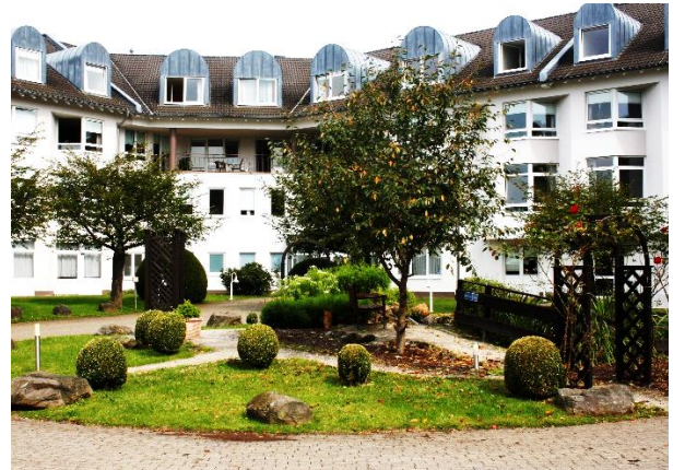
Azurit Seniorenzentrum Hildegardis - Rhénanie-Palatinat