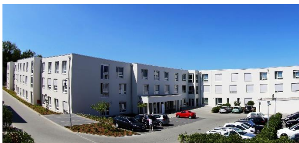
Azurit Seniorenzentrum Sörgenloch - Rhénanie-Palatinat

Le 1 avril 2021 – avant ouverture des marchés Sous embargo jusqu'à 7h30 CET