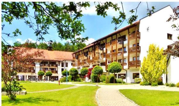
Azurit Seniorenzentrum St. Benedikt - Bavière

Le 31 mars 2021, Aedifica a signé un accord pour l'acquisition de 19 maisons de repos en exploitation en Allemagne.