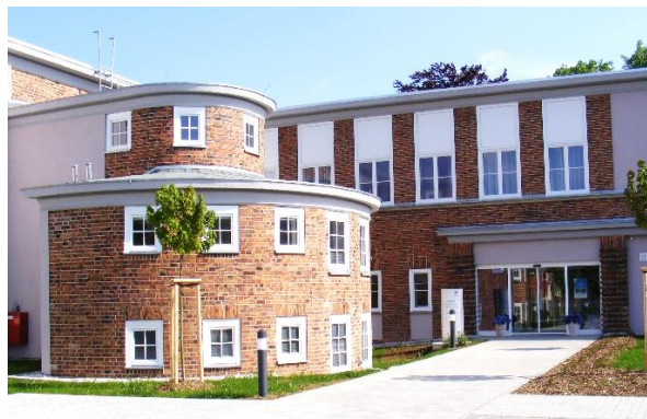
Azurit Seniorenzentrum Alte Zwirnerei - Saxe