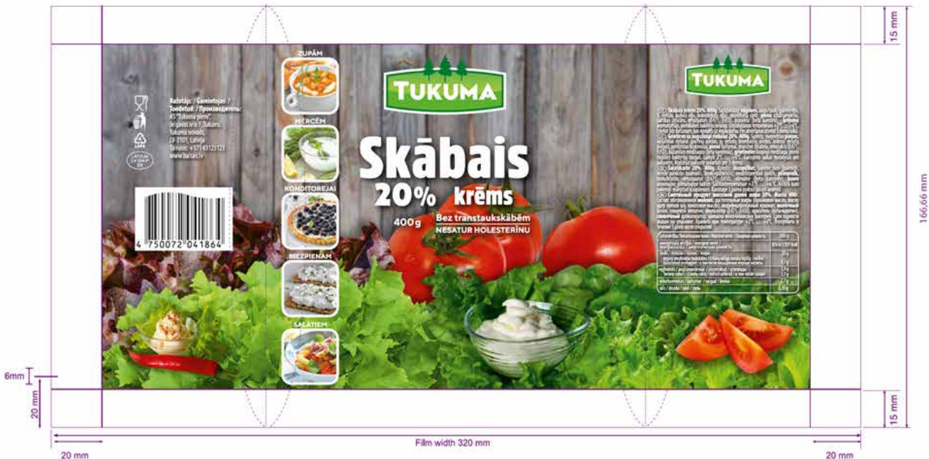
FlexoTech International Print & Innovations Awards-finaalissa olleen Tukuma Piensin tuote ”Skabais Krems”

Lontoossa järjestetyssä vuoden 2021 FlexoTech International Print & Innovations Awards -kilpailussa Elecsterin asiakkaan Tukuma Piensin tuote ”Skabais Krems” nimettiin finalistiksi kategoriassa Flexible Packaging (wide web). Finaalissa menestystä ei tullut muuta kuin maininnan verran. (Flexotechawards, 2021)