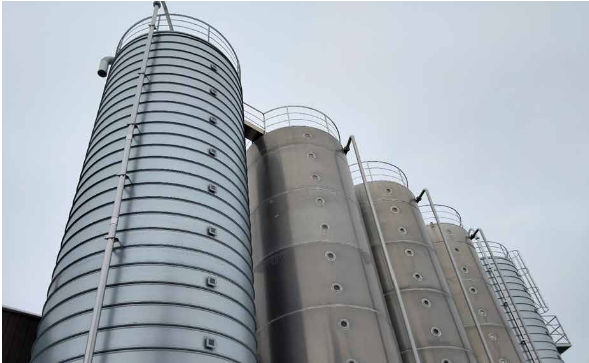
Pakkausmateriaalin raaka-aineiden varastokapasiteetti on kasvanut kahden uuden ulkosiilon avulla.

henkilön. Yhdessä varaosakaupan kanssa tämä tukee asiakkaiden tuotannollista toimintaa sekä edesauttaa varaosakaupan kasvua. Komponenttihankintoja ennakoimme siinä määrin, ettei globaali komponenttipula juurikaan heijastunut meille.