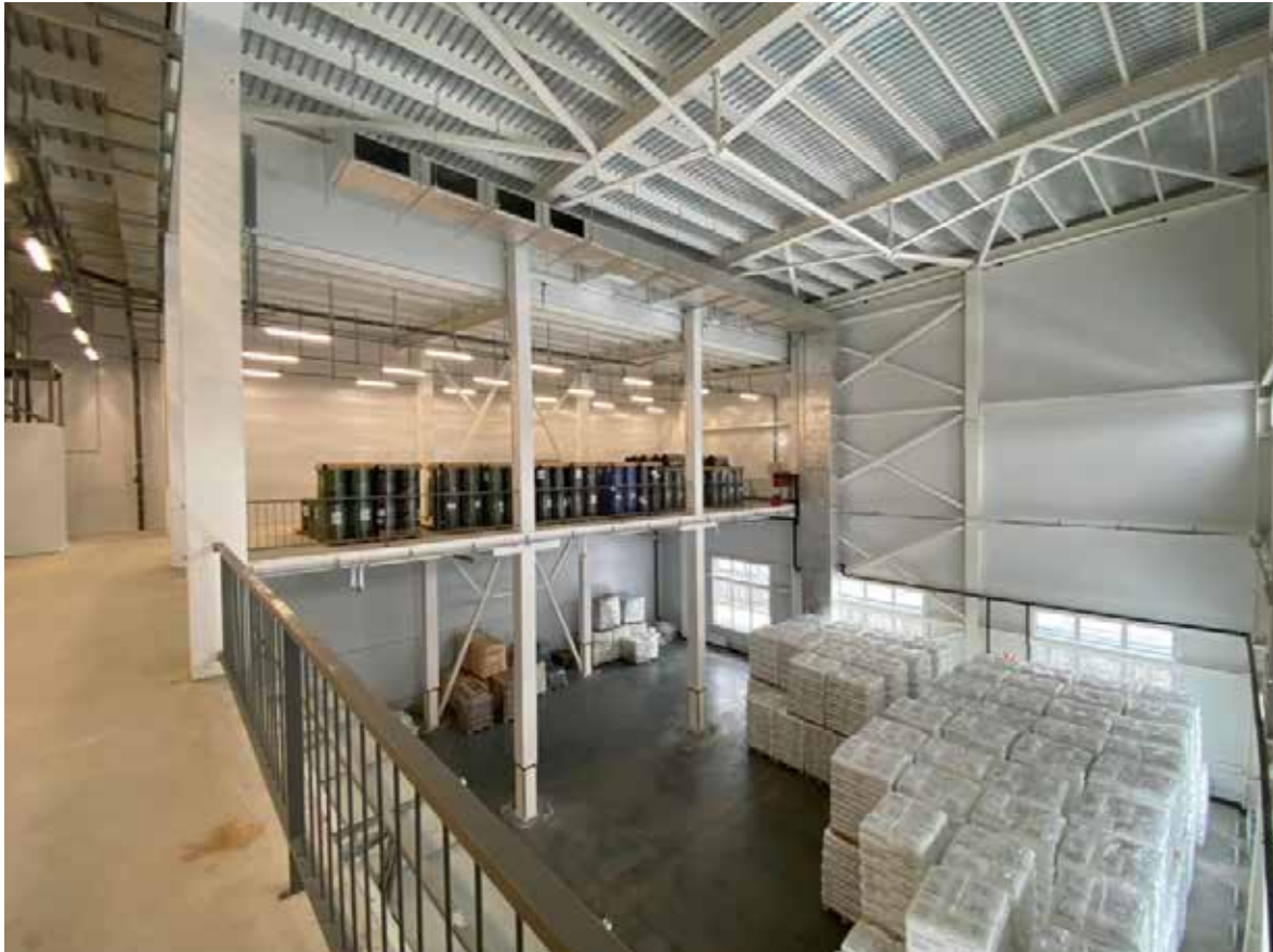
Permin kalvotehtaan vuonna 2021 käyttöönottohyväksynnän saanut varaston laajennusosa