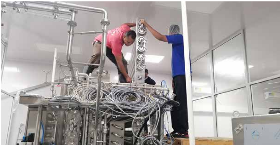
Paikallisesti asiakkaan tiloissa asennusmenetelmät vaativat ajoittain improvisointia (Belize, Western Dairies)

Elintarviketuotannon ja prosessoinnin pitää kuitenkin jatkua. Tämä tarkoittaa sitä, että investointitarvetta kertyy ja todennäköisesti se olojen vakiintuessa purkaantuu lähitulevaisuudessa. Globaalisti vaikuttava mineraaliöljypohjaisten pakkausmateriaalien merkittävä hinnannousu on nostanut