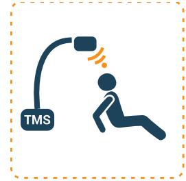
Transkraniaalinen magneettistimulaatio (TMS)