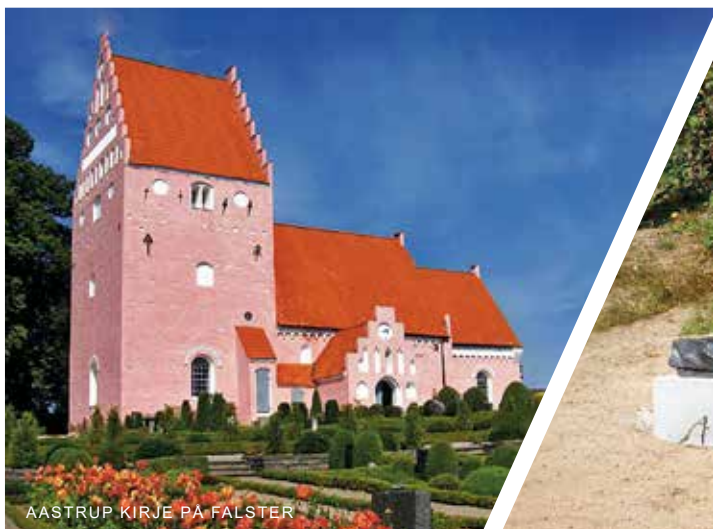
AASTRUP KIRKE PÅ FALSTER