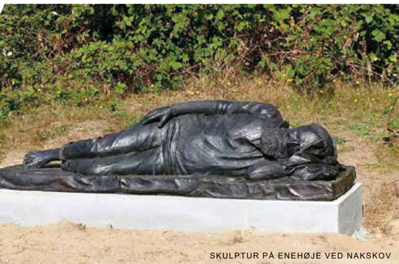
SKULPTUR PÅ ENEHØJE VED NAKSKOV