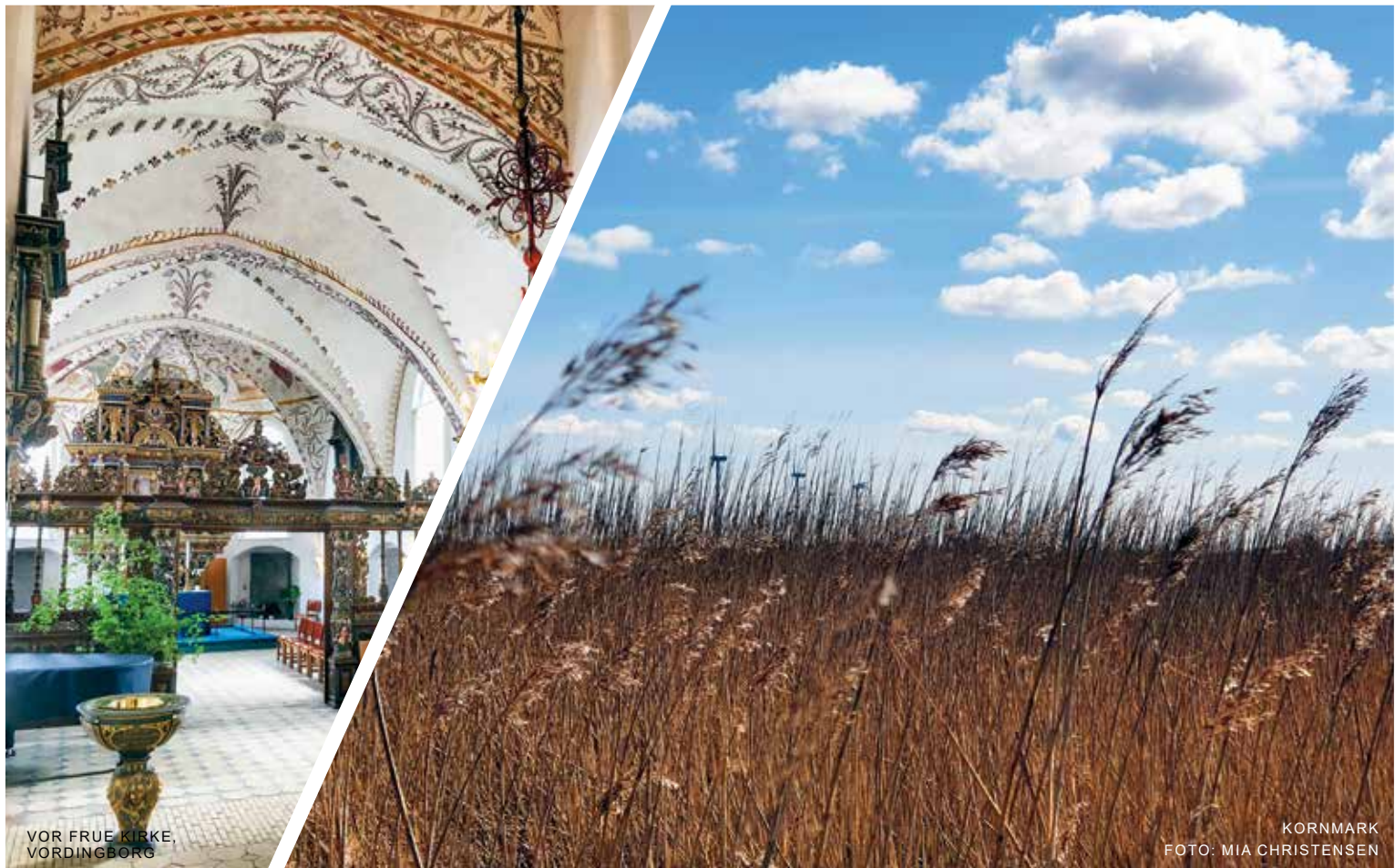
VOR FRUE KIRKE, VORDINGBORG