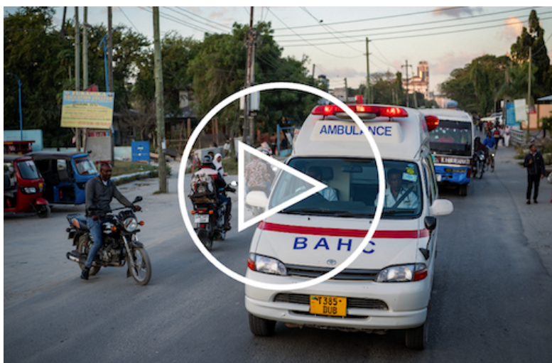
La Tanzanie est le deuxième pays qui recevra un médicament de la marque Impact : l'insuline glargine Impact.

En amont de la livraison du premier des médicaments de la marque à but non lucratif Impact, la Global Health Unit de Sanofi a étroitement collaboré avec les communautés locales, les autorités et les organisations non-gouvernementales à la mise en place et au développement de systèmes de santé durables pour les personnes qui souffrent de maladies chroniques et qui nécessitent des soins complexes, ainsi qu'à l'élaboration de programmes de sensibilisation aux maladies. À ce jour, plus de 1 800 professionnels de santé dans le monde ont bénéficié d'une formation dans le cadre d'un programme parrainé par la GHU.