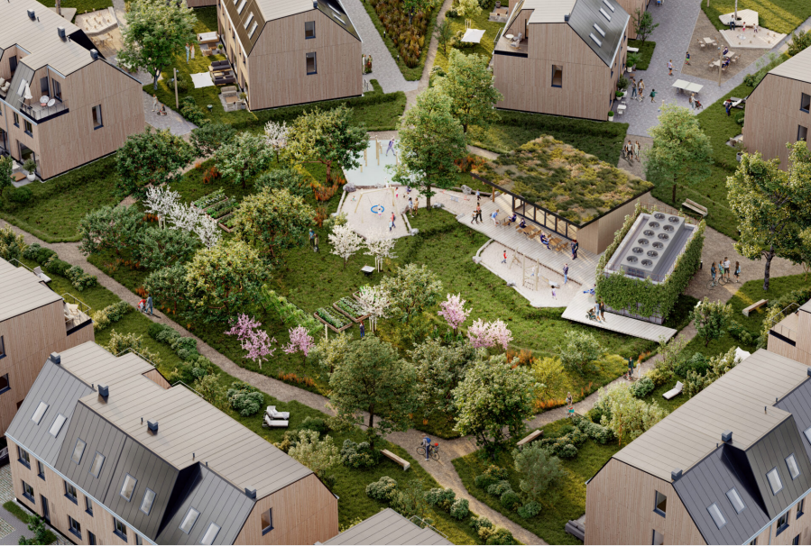
Berlin – Kokoni One