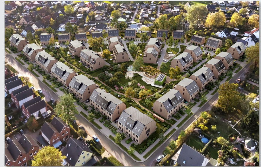
Berlin – Kokoni One