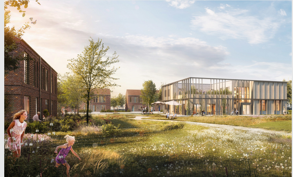
Plushusene Køge Nord

Der er ikke herudover indtruffet væsentlige begivenheder efter regnskabsperiodens udløb.