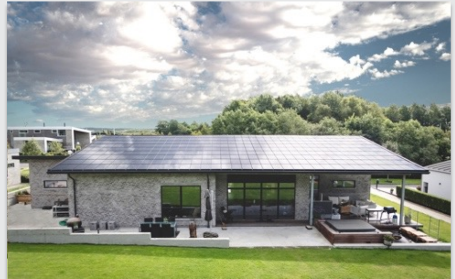
Ikast privat bolig