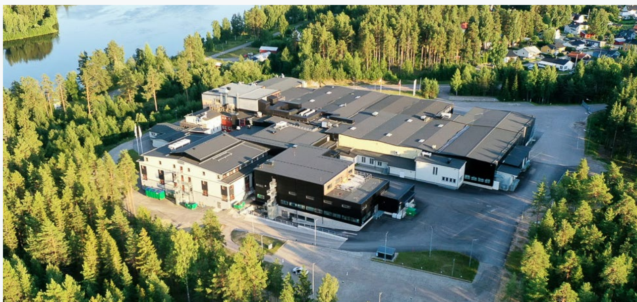
NorthX Biologics anläggning i Matfors.

Om vi tar ett steg tillbaka, är det faktum att Mendus huvudprodukt baseras på den välkarakteriserade DCOne-cellinjen, och att teamet samlat en betydande mängd data och expertis om hur man hanterar dessa celler och förvandlar dem till en produktkandidat, en stor tillgång. Som tillverkningspartner är det en väldigt bra utgångspunkt.