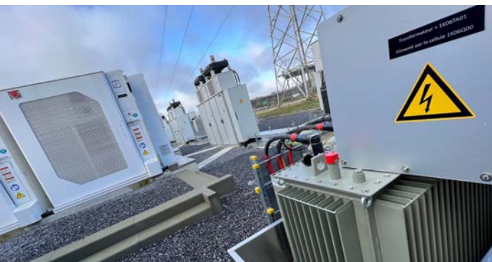
GreenStor • Le projet de batterie DSTOR à La Louvière, Belgique

MRM Health (AvH 17%) a annoncé le 30 avril que MH002, son principal candidat-produit, a reçu la désignation 'Fast Track' de la Food and Drug Administration (FDA) américaine pour le traitement de la colite ulcéreuse légère à modérée.