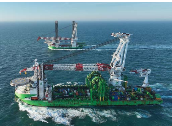
DEME • Les navires Orion et Norse Energi se croisent dans la Manche.

Malgré les turbulences et les incertitudes macroéconomiques mondiales, les activités de DEME restent robustes et la direction continue de se concentrer sur l'obtention de résultats rentables et durables. Après un premier trimestre solide, la direction de DEME réaffirme ses prévisions pour 2026, qui tablent sur un chiffre d'affaires et une marge d'EBITDA en ligne avec ceux de 2025. Les dépenses d'invest-