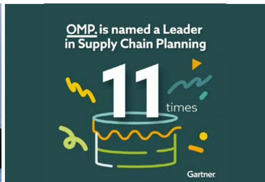
OMP • Leader du Magic Quadrant 2026 de Gartner® pour Supply Chain Planning