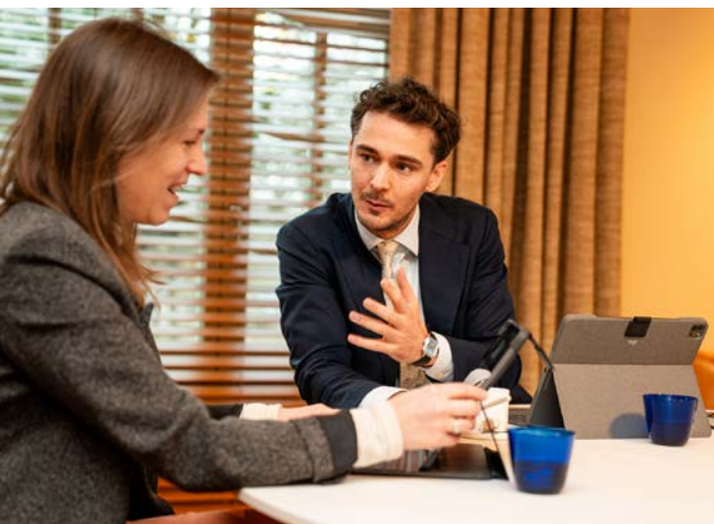
Delen Private Bank • Réunion avec un client