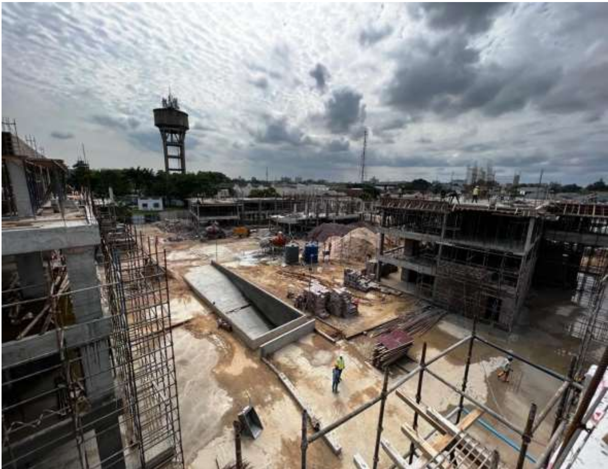
Promenade des artistes project

De bouw van de twee grootste projecten van de Groep, SILIKIN VILLAGE fase 3 en Promenade des Artistes (94 appartementen), wordt voortgezet. SILIKIN VILLAGE III is verdeeld in twee fasen, waarvan de eerste wordt opgeleverd in september 2023 en de tweede in 2024.