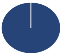
2. Investeringer i overensstemmelse med EU-klassificeringssystemet inkl. statsobligationer*