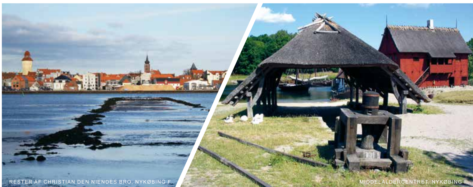
RESTER AF CHRISTIAN DEN NIEDES BRO, NYKØBING F.