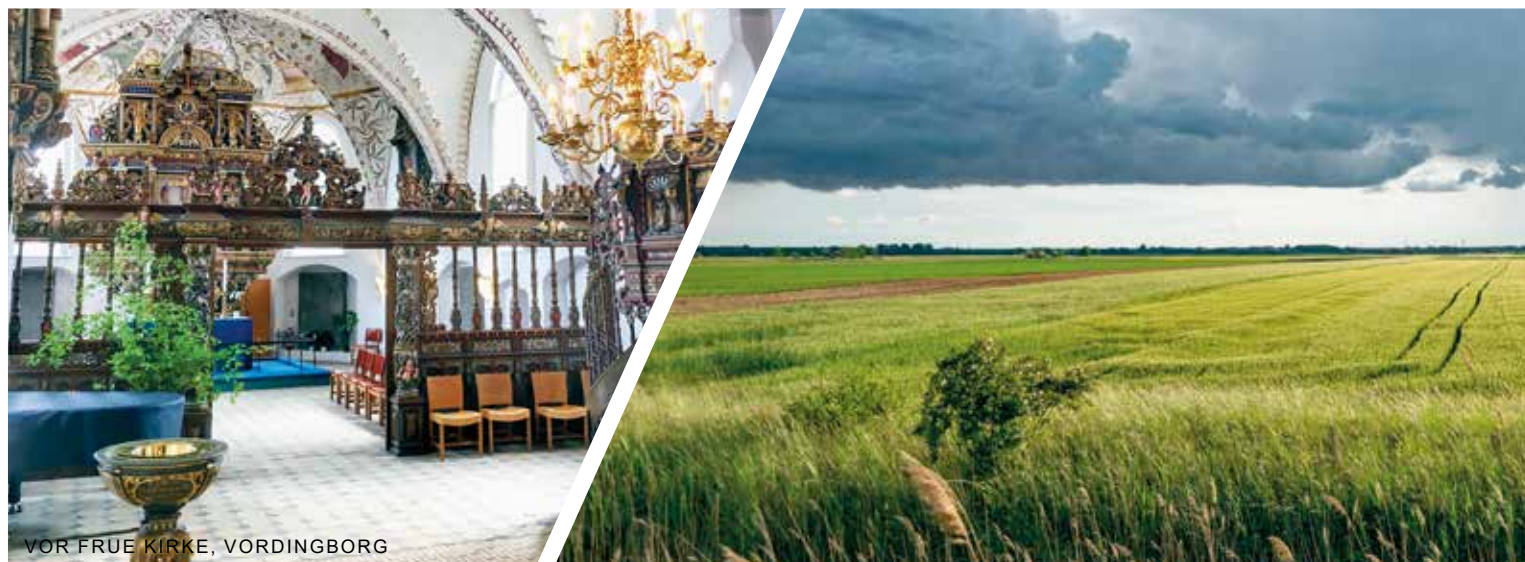
VOR FRUE KIRKE, VORDINGBORG