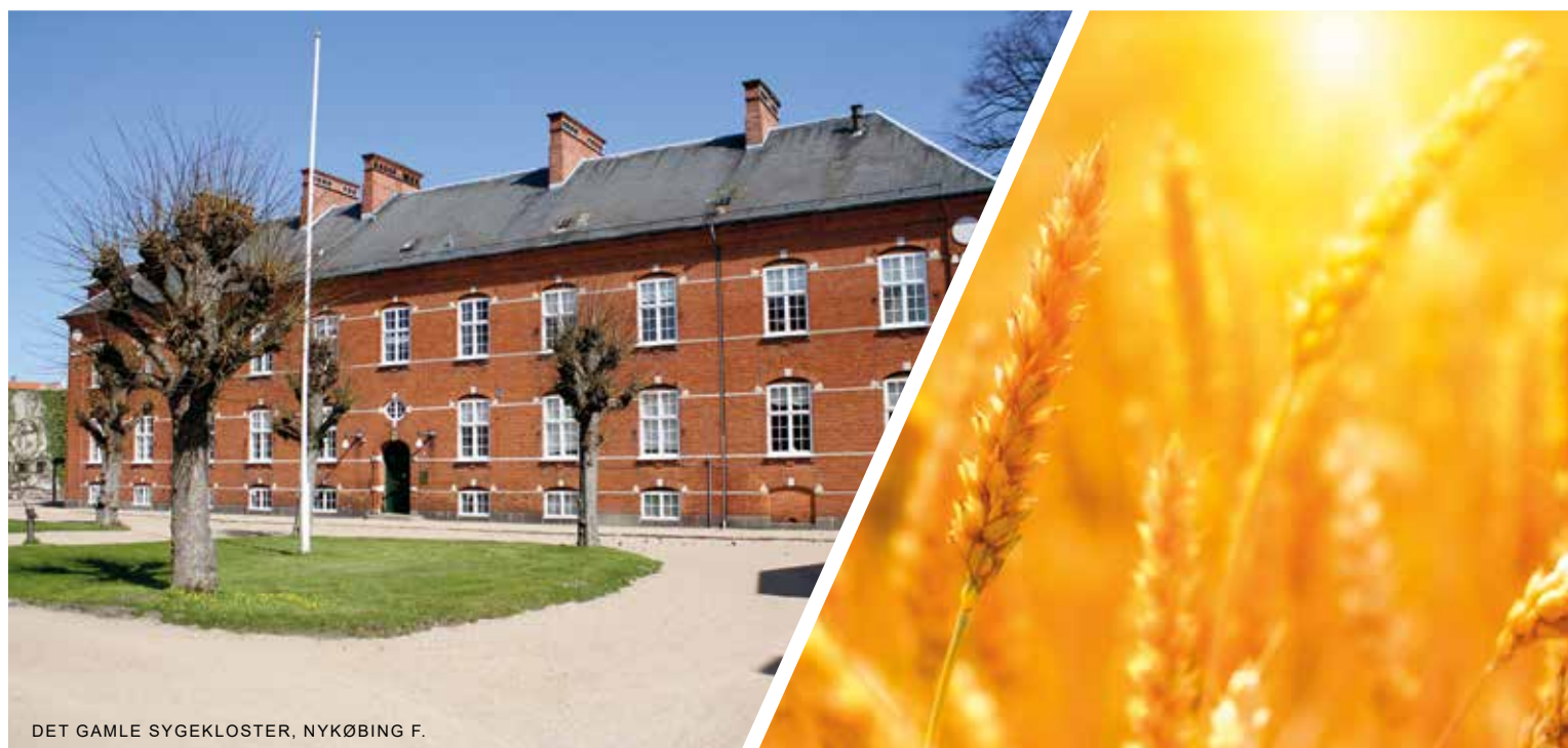
DET GAMLE SYGEKLOSTER, NYKØBING F.