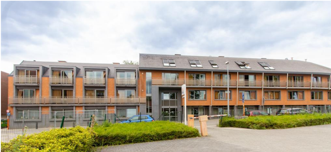
De Gouden Jaren – Tienen

Aedifica investeert ca. 8 miljoen € in een woonzorgcentrum in Tienen (België) dat reeds in exploitatie is via een inbreng in natura. In dat kader werden 90.330 nieuwe aandelen uitgegeven.