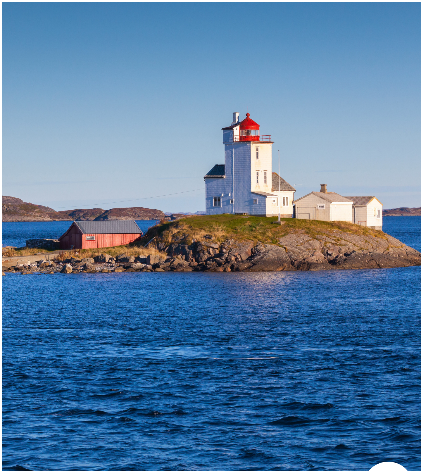
Tyrhaug fyr, Smøla