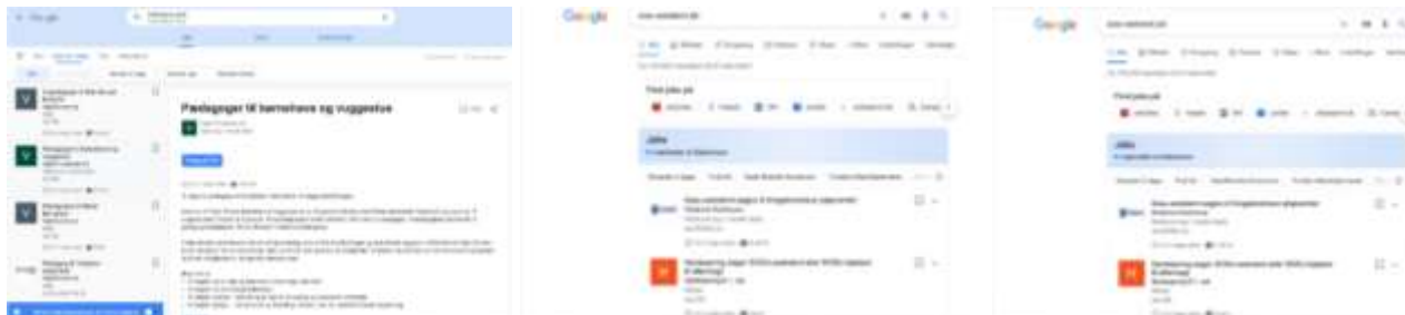
Figur 3: Skærbilleder fra Google for Jobs i Danmark, hvor jobannoncerne vises direkte hos Google

Efter 3 år har Google i april lanceret Google for Jobs i Danmark. Google for Jobs samler job fra flere forskellige jobsites ligesom Jobindex har gjort i 25 år, og er en direkte trussel mod Jobindex. Jobindex har lanceret en række faciliteter for at imødegå Google for Jobs, bl.a. evalueringer og QuickApply mobilansøgninger. Jobindex har også sammen med 164 andre sites klaget til EU over Google. Google har tidligere fået en bøde på 18 mia. kr. for at misbruge sin dominerende stilling i forbindelse med lanceringen af Google Shopping tjenesten, der minder meget om Google for Jobs.