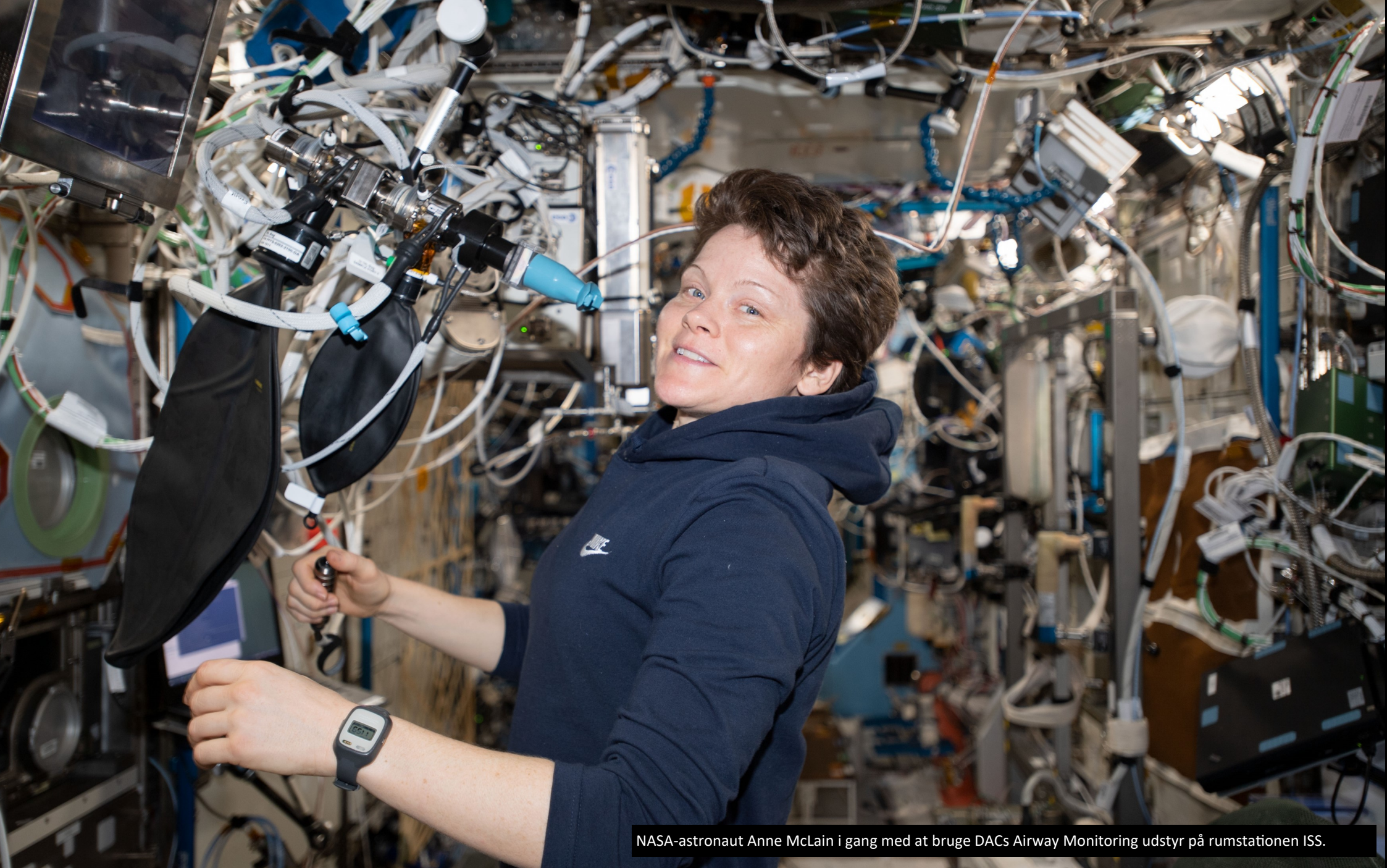
NASA-astronaut Anne McLain i gang med at bruge DACs Airway Monitoring udstyr på rumstationen ISS.