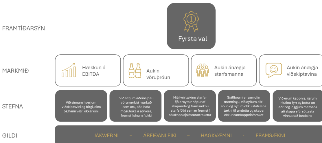
Mynd 2: Stefnupíramídi félagsins