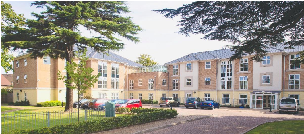
The Hawthorns – Southampton