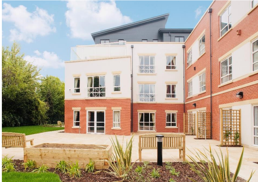
Minster Grange – York

Aedifica investeert 61 miljoen £ in een portfolio van 5 rustoorden in het Verenigd Koninkrijk die specifiek voor zorgdoeleiden gebouwd werden en reeds in exploitatie zijn.