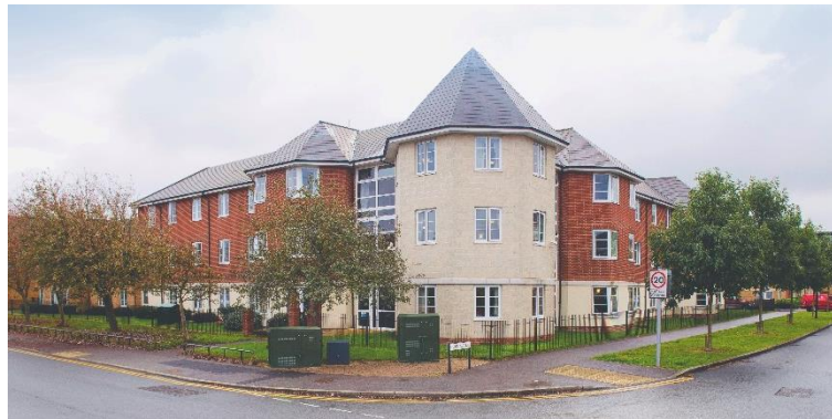
Princess Lodge – Swindon

14 januari 2020 – vóór opening van de markten Onder embargo tot 07u30 CET