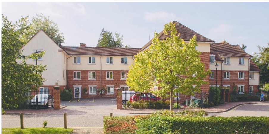
Deepdene – Dorking

14 januari 2020 – vóór opening van de markten Onder embargo tot 07u30 CET