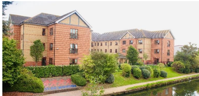
The Grange – Southall

14 januari 2020 – vóór opening van de markten Onder embargo tot 07u30 CET