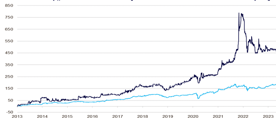
10-ies metų „Invaldos INVL“ akcijos kainos ir OMX Vilnius indekso pokytis