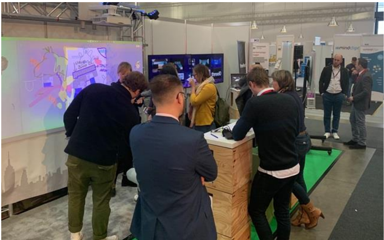
January 2020 – HoyluWall featured at the LearnTec Conference in Karlsruhe. Pictured: A Creative session with Daimler Consulting.