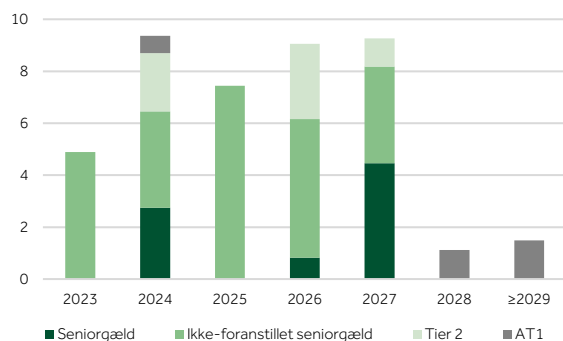
Afløbs- og call-dato profil (mia. kr.)

Afløbsprofilen for koncernens usikrede seniorgæld mv., opgjort ultimo 1. kv. 2023, er illustreret i den forudgående figur.