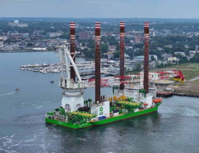
Offshore Energy | Vineyard - VS

groene waterstofproject van DEME, Hyport, en Global Sea Mineral Resources, blijven op schema.