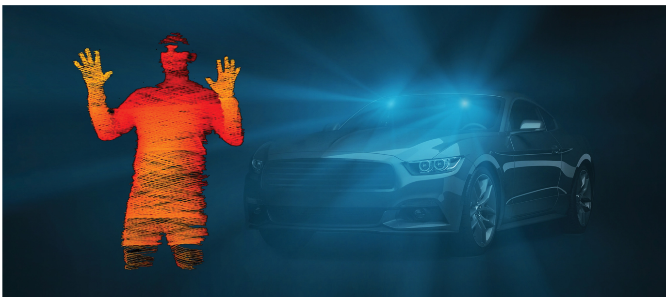
Scanning av en människa med hjälp av VoxelFlow™.