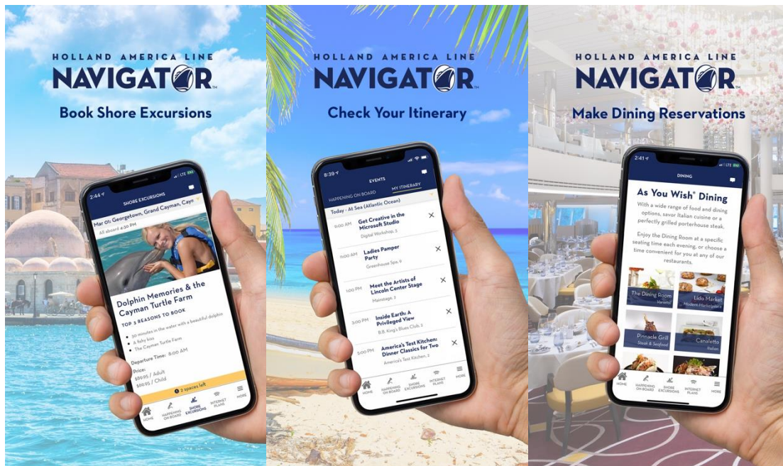
Holland America Line Navigator mobilapplikation

krav på dataintegritet och säkerhet. Under året har vi framgångsrikt genomfört ett antal externa säkerhetsgranskningar för att kvalificera oss som leverantör åt större kunder.