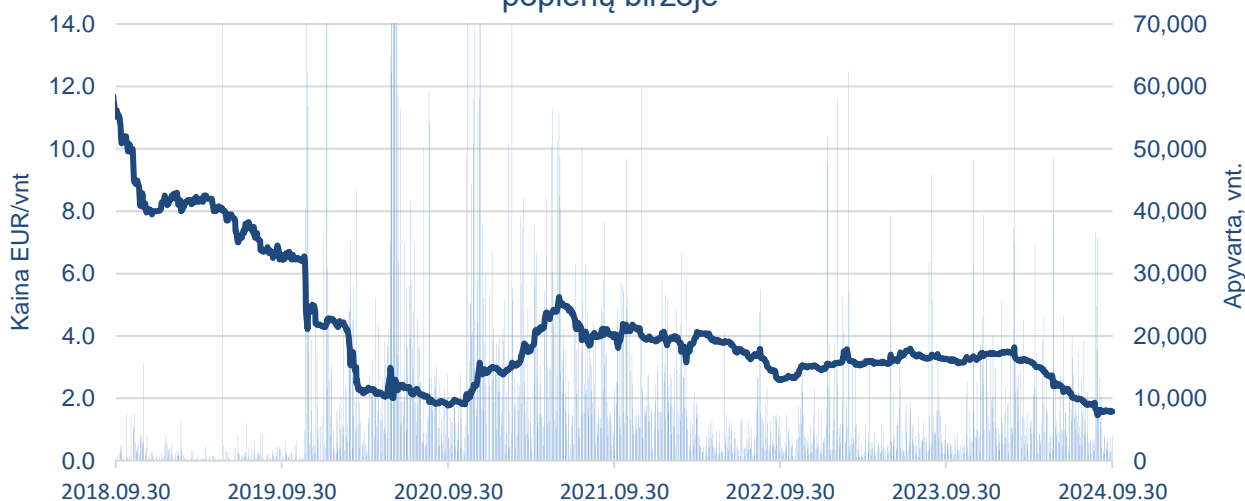
AB Novaturas akcijų kaina ir apyvarta Nasdaq Vilnius vertybinių popierių biržoje

2024 m. rugsėjo 30 d. Bendrovės rinkos kapitalizacija buvo 17.02 mln. Eurų – per trečiąjį metų ketvirtį sumažėjo 28 proc.