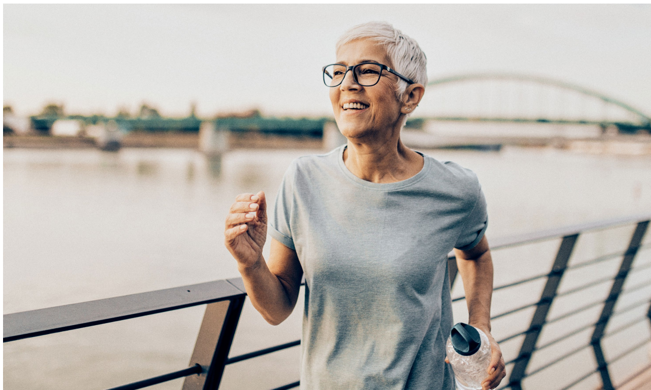
Cancerbehandling utan att skada hälsa eller livskvalitet.

Mendus utvecklar nya cancerterapierna genom att utnyttja immunsystemets förmåga att kontrollera kvarvarande sjukdom och förlänga överlevnaden hos cancerpatienter utan att försämra hälsan eller livskvaliteten.