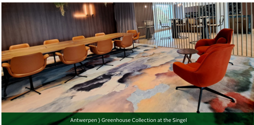
Antwerpen › Greenhouse Collection at the Singel