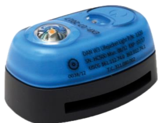
Dan W3, Daniamants mest solgte sikkerhedslys til redningsveste

Markedet for sikkerhedslys til lokalisering af overlevende kan karakteriseres som en nicheforretning inden for redningsudstudsindustrien. Et vigtigt aspekt af markedet er de forskellige kvalitetscertificeringer og internationale standarder, som er lovkrav. Leverandørerne og kunderne skal være i besiddelse af alle nødvendige godkendelser for både virksomheden og dets produkter, herunder ISO 9001, MED, SOLAS, ATEX, IECEx samt yderligere en række internationale godkendelser. Alle ovennævnte certificeringer skal fornyes løbende.