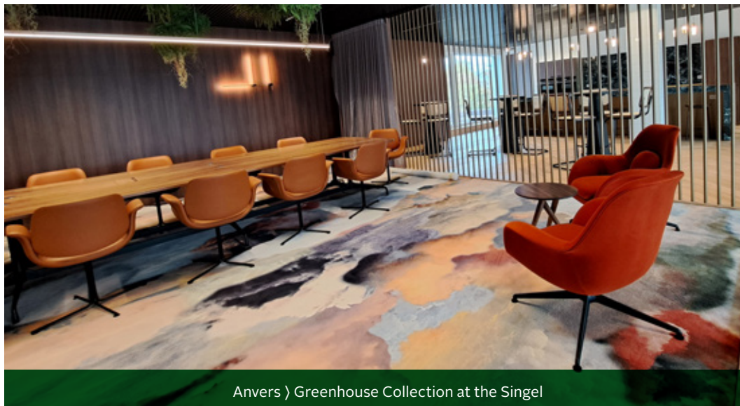
Anvers › Greenhouse Collection at the Singel