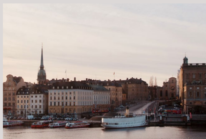
Head Office Västra Trädgårdsgatan 15 111 53 Stockholm Sverige