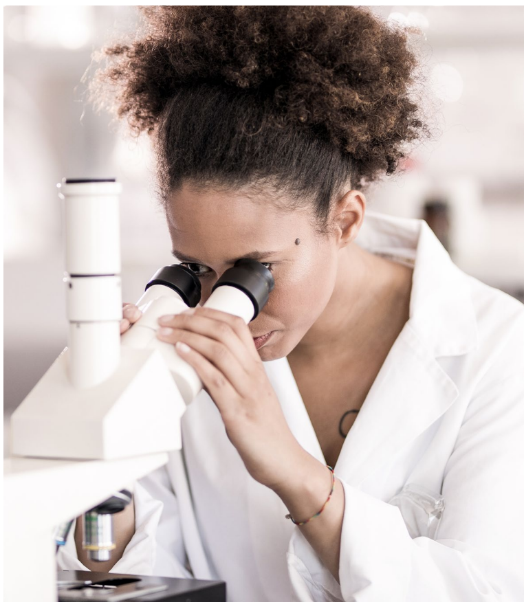
Mendus har förberett sig för nästa kliniska utvecklingssteg med ilixadencel för att etablera proof-of-concept i tumörer som svarar dåligt på dagens tillgängliga terapier.

Proof-of-concept-data från monoterapistudien ADVANCE II stödjer den bredare positioneringen av vididencel som en ny underhållsbehandling av AML. Som ett steg mot pivotala studier kommer Mendus att förbereda sig för en kombinationsstudie med oralt azacitidin, den enda godkända underhållsbehandlingen för AML-patienter som inte är lämpade för