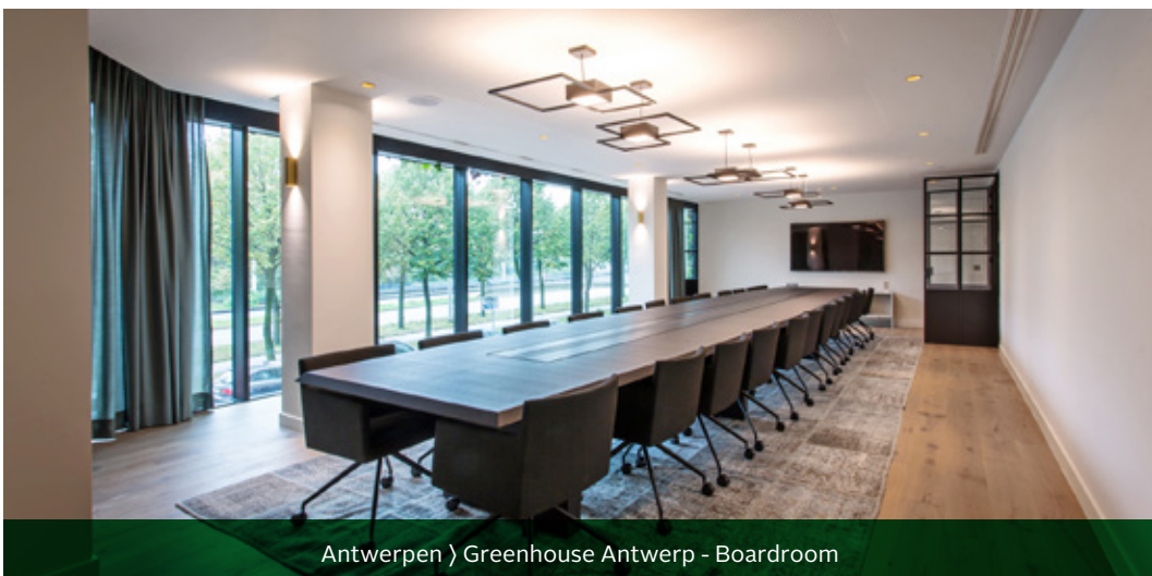
Antwerpen } Greenhouse Antwerp - Boardroom

De volledige agenda en alle bijhorende stukken voor de algemene vergadering zijn beschikbaar op www.interinvest.eu , onder Investeerders/Aandeelhoudersinformatie/Algemene vergaderingen .