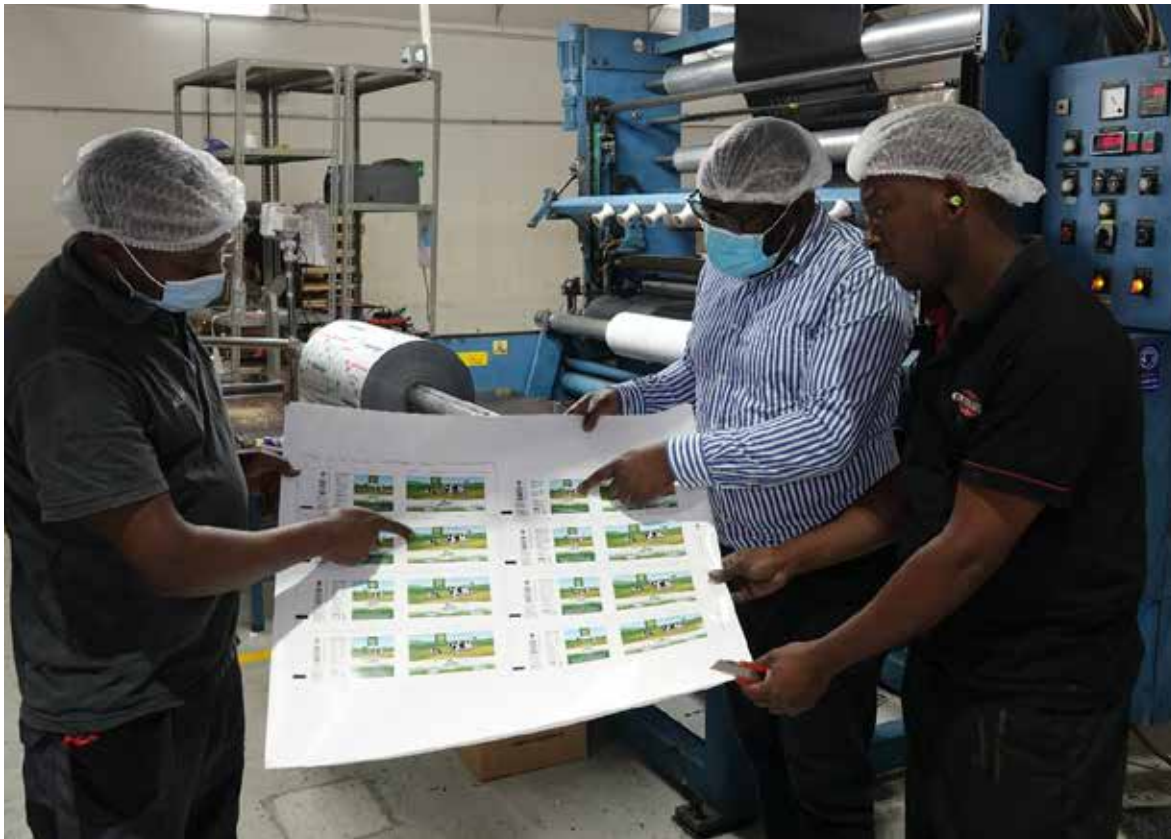
Kenian tehtaalla tarkastetaan painovedosta

Huolimatta pienentyneestä maidon tuotantokapasiteetista Elecster Kenya Ltd. pystyi säilyttämään tuotantovolyyminsä edellisvuoden tasolla onnistuneen asiakashankinnan myötä.