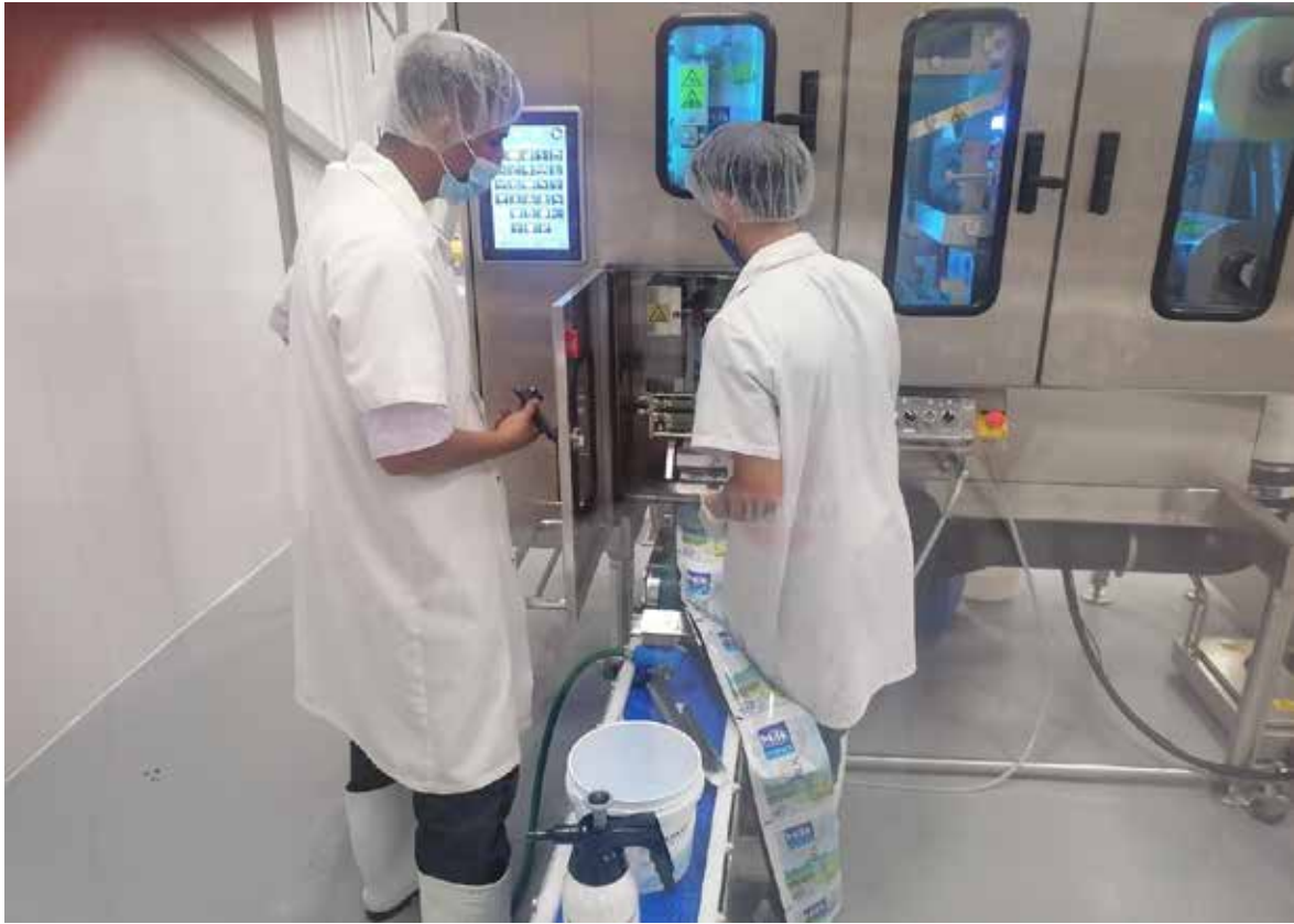
UHT-linjan käyttöönotto Belizessä vuonna 2022

na. Alkuvuonna Belizessä käyttöön otettu UHT-linjasto on maan ensimmäinen UHT-tuotteita prosessoiva laitteisto. Laitteisto on lähtenyt kivuttomasti käyntiin, mikä osoittaa Elecsterin teknisen ja muun tuen toimivaksi.