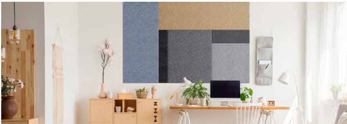
Sanduddin valikoimiin kuuluu myös seinien tasoittamiseen ja akustiikan parantamiseen liittyviä tuotteita

Tapettituotteidemme päämarkkina-alueena ovat Pohjoismaiden lisäksi Eurooppa. Sandudd-tapetteja ja FinnTurf-ruohomattoja viedään yhteensä yli 50 maahan ympäri maailmaa.