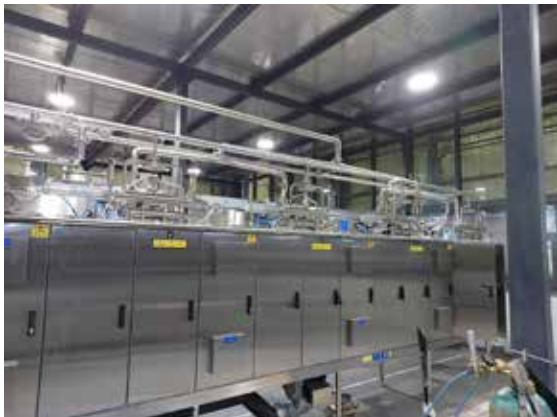
Linjan asennusta Intiasta SMC Creamy Foods Pvt.Ltd tiloissa Delhin lähellä Noidassa.

Intiassa Inflaatio on yli 20%, minkä lisäksi valtiossa on tapahtunut jonkinasteinen sotilasvallankaappaus. Intia neuvottelee IMF:n kanssa lainajärjestelystä. Vallasta syösty oppositio yrittää saada vaalit aikaan. Elecsterin kannalta positiivista on se, että keskustelukanavat kaikkien UHT-linjojen valmistajien ovat auki ja oikeaa kiinnostusta varsinkin UHT-pussituotteeseen on olemassa. Intian kansantalouden pitää kuitenkin päästä tukevasti jaloilleen ennen mahdollisten investointien alkamista.