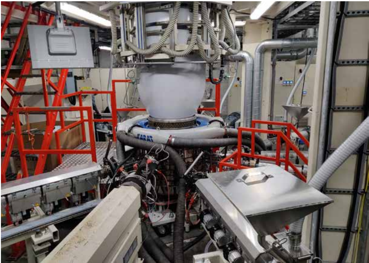
Uusi 12/9-kerroksinen ekstruuderit

IT:n osalta Elecster lähti vuoteen 2022 uuden yhteistyökumppanin kanssa, joksi valikoitui pitkien keskustelujen jälkeen suomalainen palveluntuottaja Decens Oy. Decensin kanssa solmittu yhteistyösopimus parantaa yrityksen tietoturva ja luo varmuutta yhä enemmän verkossa toimiviin toimintaympäristöihin. Myös pitkäaikainen tulostuskumppani vaihtui: uutena kumppanina on nyt Wellbit Oy, joka toimittaa Ricohin tulostimia. Ricohin laitteisiin päädyttiin, koska Ricohin tulostusympäristössä on monia hyviä tekijöitä, tärkeimpänä turvatulostusominaisuudet. Viime vuoden aikana panostimme erityisen paljon tietoturvaan, ja siihen on tarkoitus kiinnittää entistäkin enemmän huomiota tulevaisuudessa.