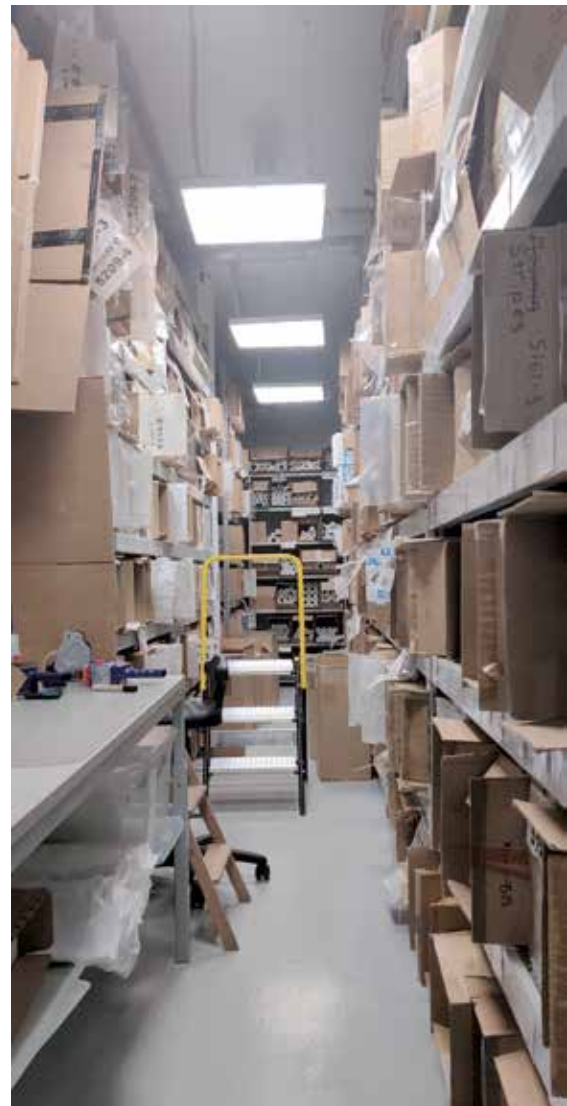
Sandudd tapettien maahantuonti on myös osa Finnpackin toimintaa. Nyt tapeteillekin on isompi varasto.

Finnpack toimii myös Sandudd-tapettien Venäjän virallisena maahantuojana. Sandudd-tapettien myynti Venäjällä on kasvanut tasaisesti pandemiasta huolimatta.