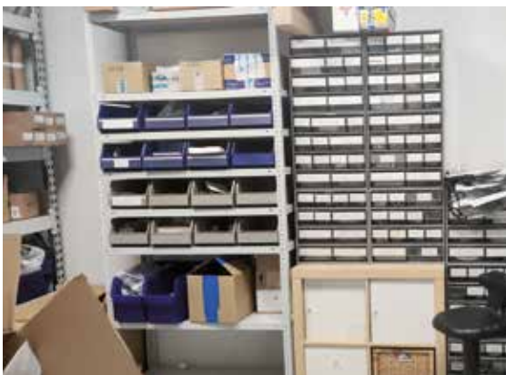
Muokattu: Myös Elecsterin koneiden varaosat mahtuvat paremmin uusiin Pietarin toimitiloihin.