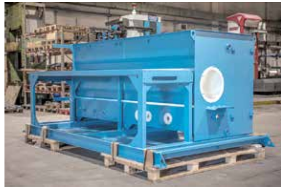
Valmis säiliö uudelle ruotsalaiselle asiakkaalle.

Suurin osa valmistettavista tuotteista tehdään paperi-, kairo- ja elintarviketeollisuuden koneisiin ja laitteisiin. Tämän vuoksi käytettävästä materiaalista yli kaksi kolmasosaa on ruostumatonta tai haponkestävää terästä. Viennin osuus Eesti Elecsterin tuotannosta on yli 90 %. Vuoden 2020 aikana Eesti Elecster sai uusia asiakkaita Suomesta, Tanskasta ja Ruotsista. Samoin Norjassa on useita yrityksiä Eesti Elecsterin palveluksista kiinnostuneita yrityksiä. Monen potentiaalisen asiakkaan kanssa on sovittu mahdollisia toimituksia heti, kun matkustaminen aukeaa jälleen.