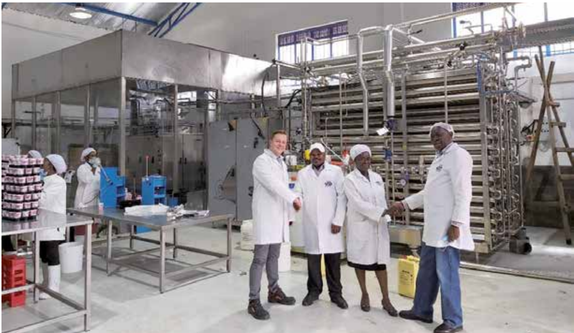
Bahati Dairyn johtohenkilöt vastaanottavat Elecsterin myyntitiimin onnitellut kaupalliseen tuotantoon siirtymisen johdosta. Taustalla Elecsterin toimittama UHT-linja.

Ajoittain tiukoistakin matkustusrajoitteista johtuen kaupallisia neuvotteluja käytiin nyt enemmän etäyhteyksiä hyödyn-