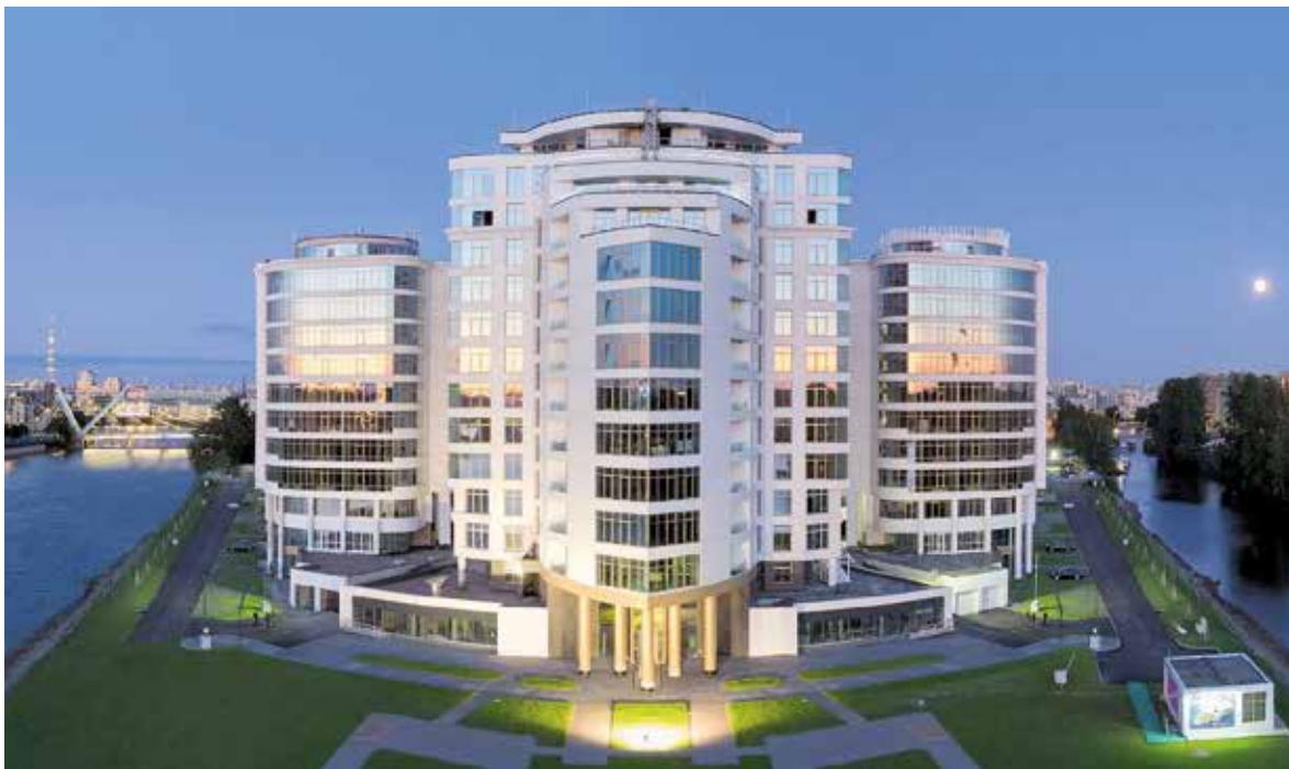
Havainnekuva Pietarin toimiston rakennuksesta ulkopuolelta.

Elecster toimii Venäjällä tuotemerkillä Finnpack, koska nimellä on vahva imago ja vuosikymmenten perinteet paikallisessa meijeriteollisuudessa. Finnpackilla on Venäjällä kaksi toimipistettä: toimisto Pietarissa ja kalvotehdas Permissä. Permin kalvotehdas pitää huolen siitä, että IVY-maiden alueen asiakkaille saadaan nopeasti toimitettua hyvälaatuista pakkausmateriaalia Elecsterin toimittamiin pakkauskoneisiin. Permin kalvotehdastaan tiloihin on tullut noin 40 % lisää tuotannon toimitilaa, mikä mahdollistaa entistäkin laadukkaamman kalvonvalmistamisen tason. Uuden toimitilan rakentaminen on vielä sisäpuolelta kesken, mutta tilat on tarkoitus ottaa käyttöön vuoden 2021 aikana.