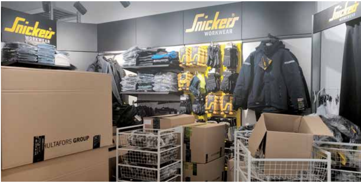
Pietarin toimiston uusissa toimitiloissa on nyt myös mahdollista päästä sovittamaan Snickers workwear tuotteita paikanpäälle.

Covid-19 pandemia on hiljentänyt konekauppaa venäjänkielisissä valtioissa. Kalvon tuotanto ja myynti on jatkunut samalla mallilla kuin edellisenä vuonna. Asiakaspalvelua parantaakseen Finnpack on laajentanut toimintaa työvaatteiden maahantuontiin ja toimii myös Snickers Workwearin Venäjän virallisena maahantuojana. Vuoden 2020 aikana Finnpack onkin kehittänyt työvaatteiden myyntiä ja avannut onnistuneesti verkkokaupan osoitteessa www.workwear.pro , mistä uudet ja vanhat asiakkaat nyt saavat tehtyä ostoksensa kätevästi.