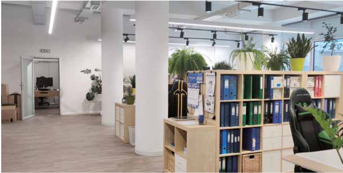
Finnpackin uudet modernit toimitilat Pietarissa.

Sandudd-tapetteja ja FinnTurf-ruohomattoja viedään yhteensä yli 50 maahan ympäri maailmaa.