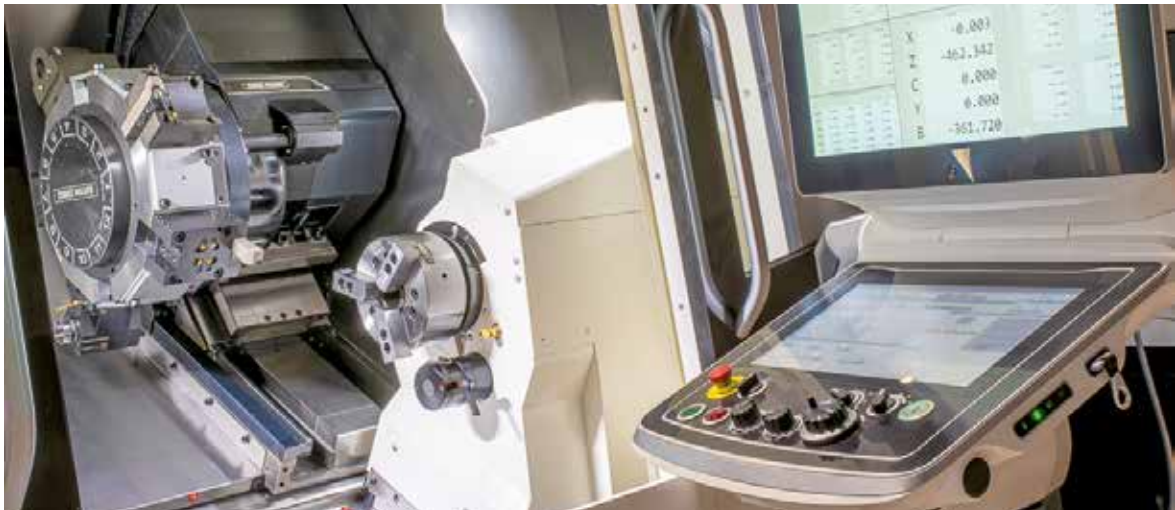
Eesti Elecsterin modernit työstökoneet takaavat laadukkaan lopputuloksen alihankintaan lähteville osille.

Metallialan alihankintakonepajoilla kilpailu on kovaa. Korkea laatu, nopea toimitusaika ja toimitusvarmuus ovat auttaneet meitä säilyttämään lujat suhteet asiakkaisiimme.