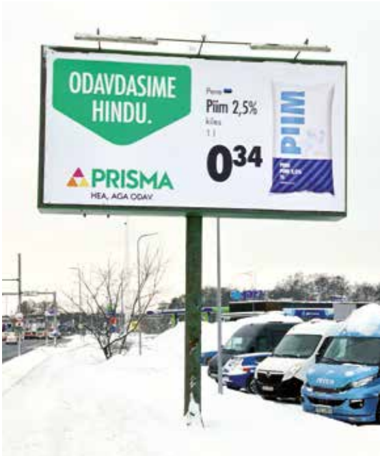
Ensimmäinen pussimaidon ulkomainos. Prisman oma tuotemerkki, jonka pakkaajana Valio ja Elecsterin kalvo.