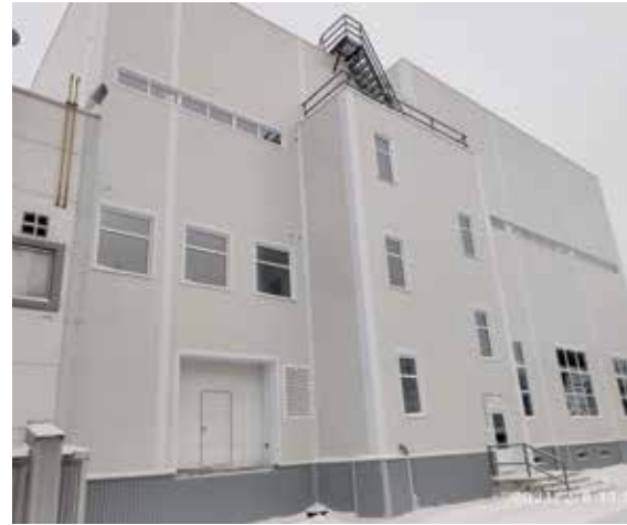
Permin kalvotehaan vuonna 2020 valmistunut laajennusosa.