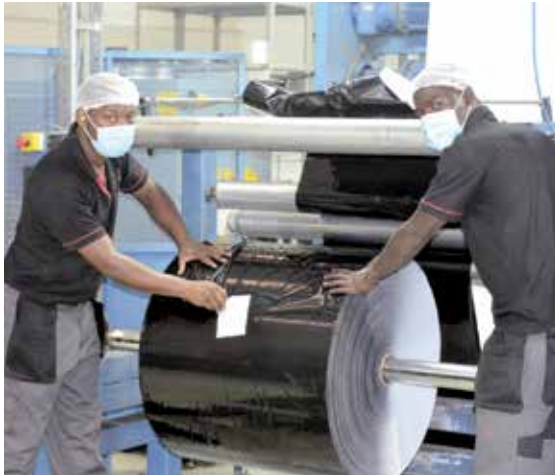
Kalvonajoa Elecster Kenian tehtaalla.