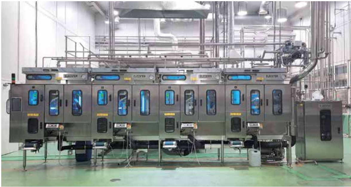
Meksikalaiseen Sello Rojon meijeriin toimitettiin kapasiteetiltaan linjastomme suurin pakkauskone, EA-16000.