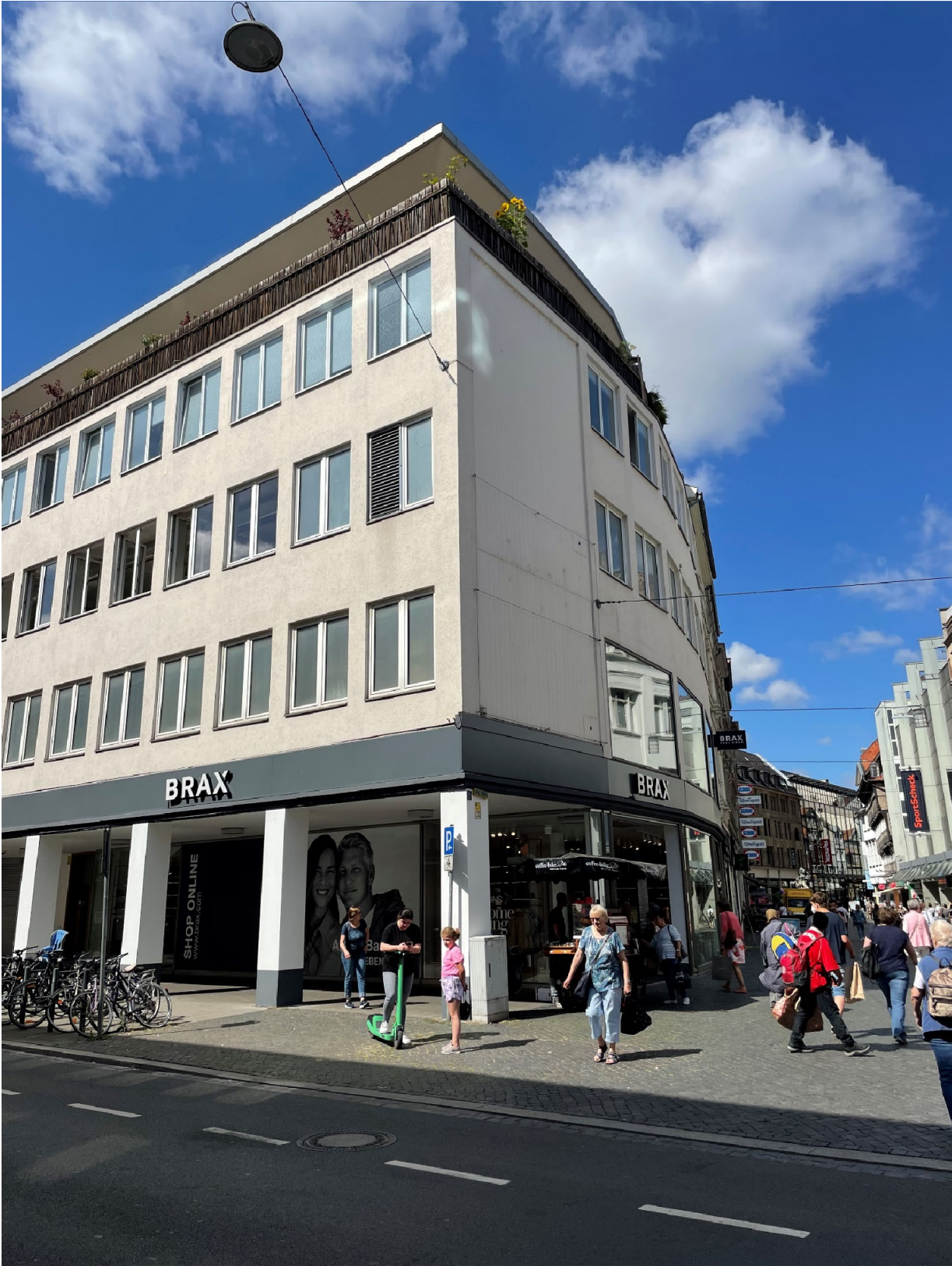
Ejendommen Braunschweig Münzstrasse