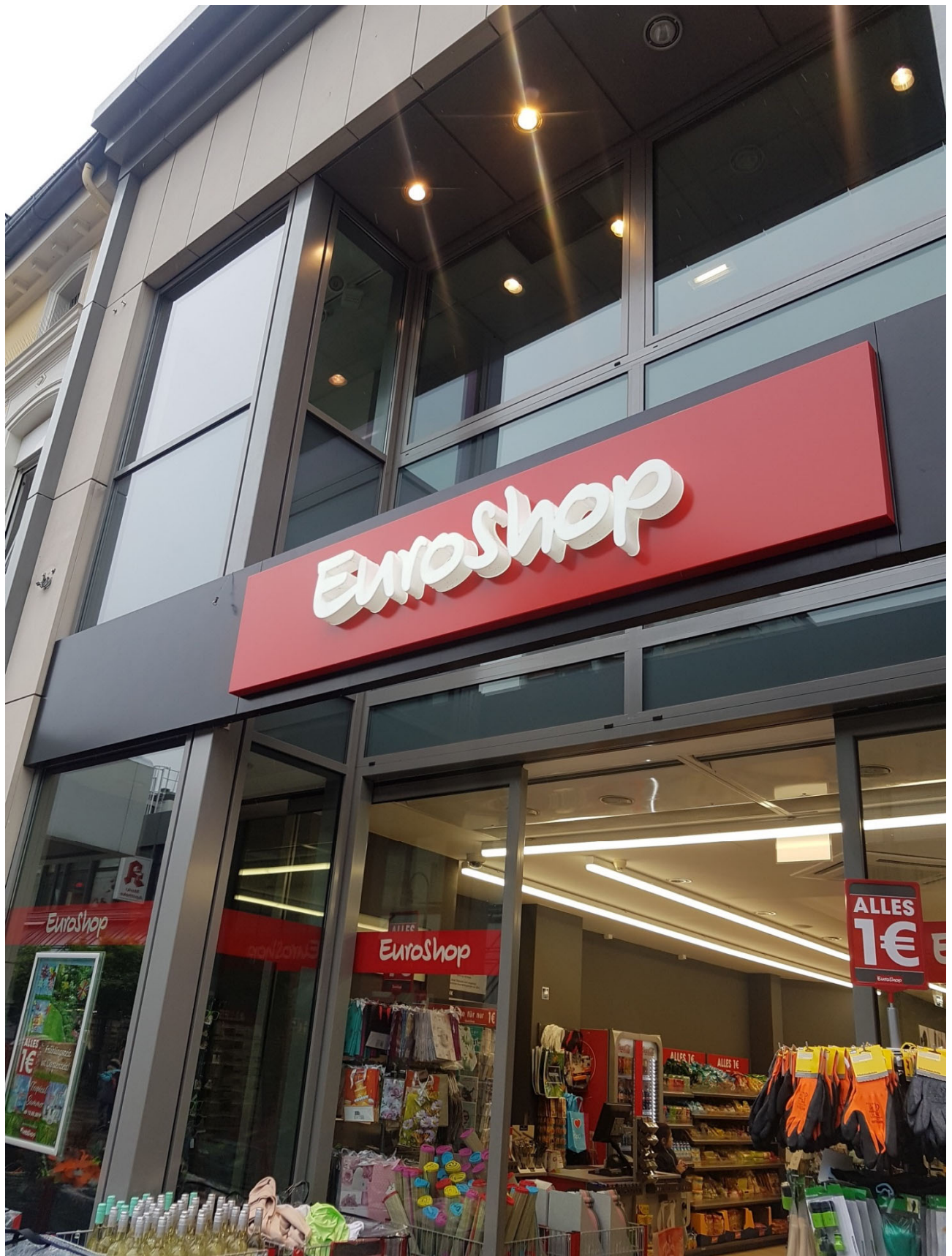
Ejendommen i Leverkusen