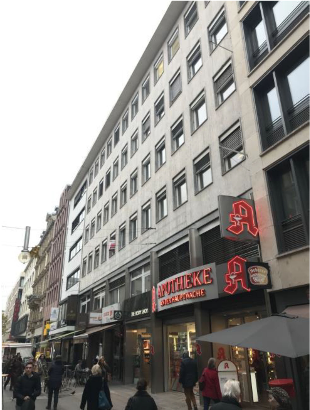
Ejendommen på Schillerstrasse, Frankfurt