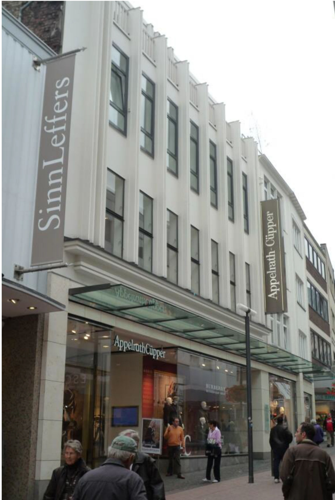
Grosskölnstarsse 20-28, Aachen