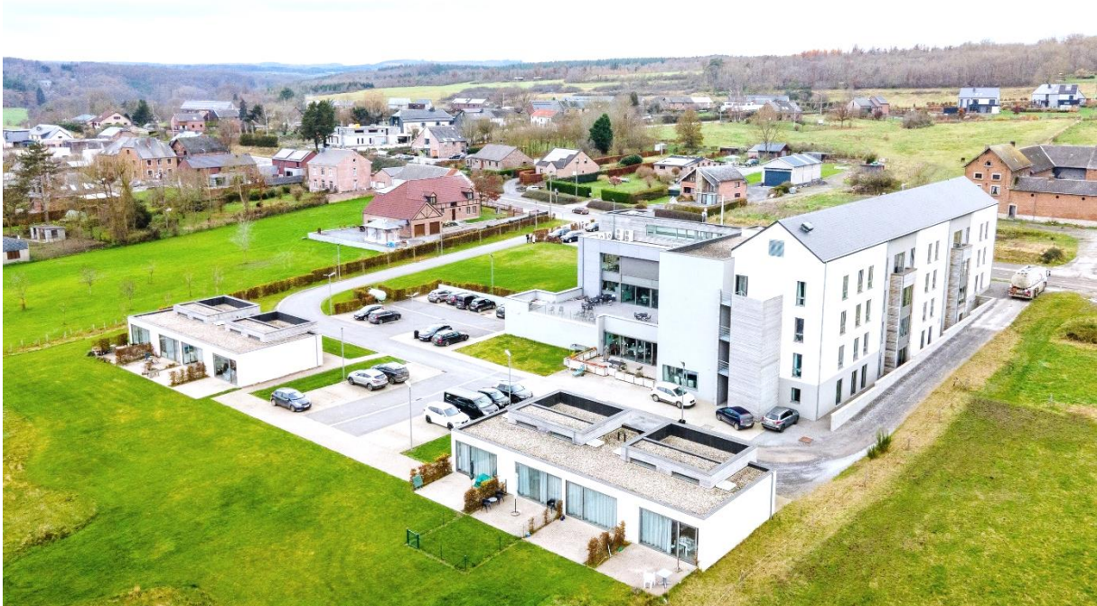
Résidence Véronique – Somme-Leuze

Aedifica zal ca. 21 miljoen € investeren in de acquisitie en uitbreiding van een woonzorgcentrum in Somme-Leuze (België). De acquisitie van het bestaande gebouw wordt gefinancierd via een inbreng in natura. In dat kader werden 74.172 nieuwe aandelen uitgegeven