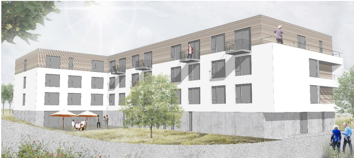
Uitbreiding van Résidence Véronique (illustratie) – Somme-Leuze

17 mei 2022 – vóór opening van de markten