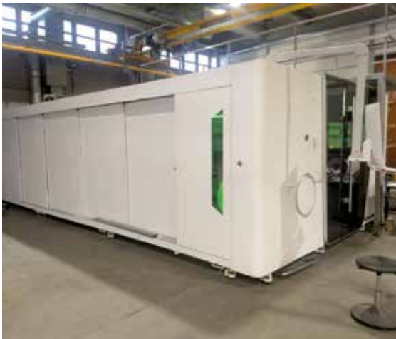
Reisjärven tehtaalla uusi combi-kuitulaserleikkauskone. Tällä koneella voi myös tehdä putkileikkauksia.

Reisjärven kiinteistöä on kunnostettu ja tehty mittavia lattiapinnoituksia varastoalueille. Lisäksi Reisjärven tehtaalla on aloitettu loppuvuodesta toimiston tietoverkkoliikenteen saneeraustyöt. Töiden oletetaan päättyvän maaliskuussa 2020.