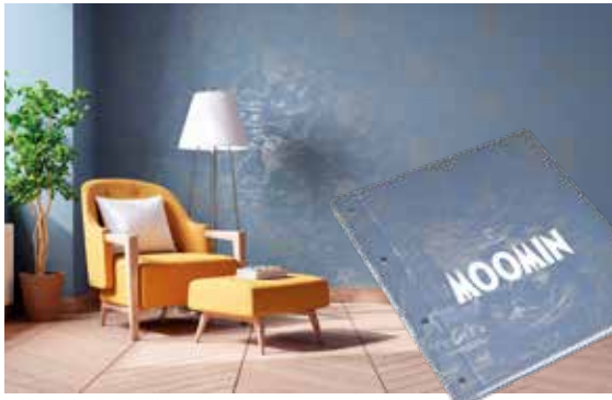
Tove Janssonin luomat Muumi-hahmot ovat esiintyneet Sandudd Oy:n tapeteissa jo 40-luvulta lähtien. Loppuvuodesta 2019 esiteltiin uusi, merihenkinen Muumikokoelma.