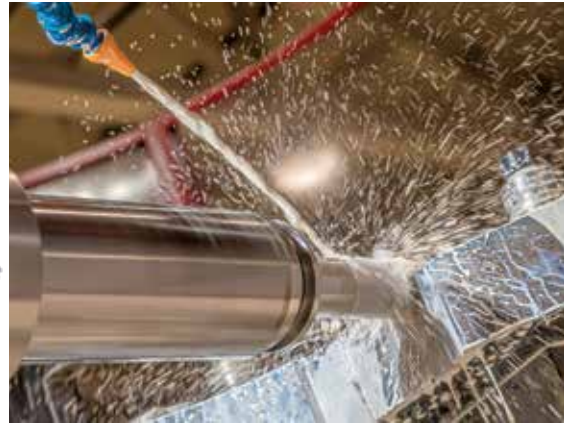
Uusi työstökone Fermat WTF 11 CNC toiminnassa