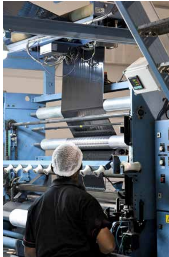
Kalvonajaja Elecster Kenian tehtaalla

Elecster-brändin tunnettuus yhdistettynä tuotteiden ja palveluiden paikalliseen saatavuuteen on tuonut positiivista virettä myös meijerikoneiden myyntiin alueella.