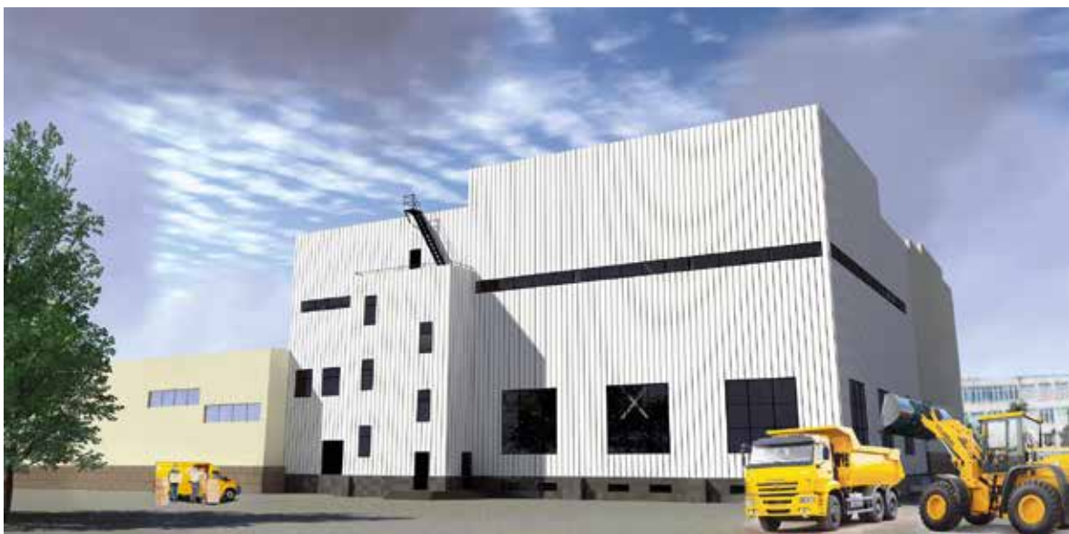
Luonnos Permin kalvotehdaan laajennuksesta, jonka on määrä valmistautua toukokuussa 2020.

Eesti Elecster on onnistunut kasvattamaan tilauskantaa ja vakiinnuttamaan paikkansa mm. Outotecin alihankintakonepajana.