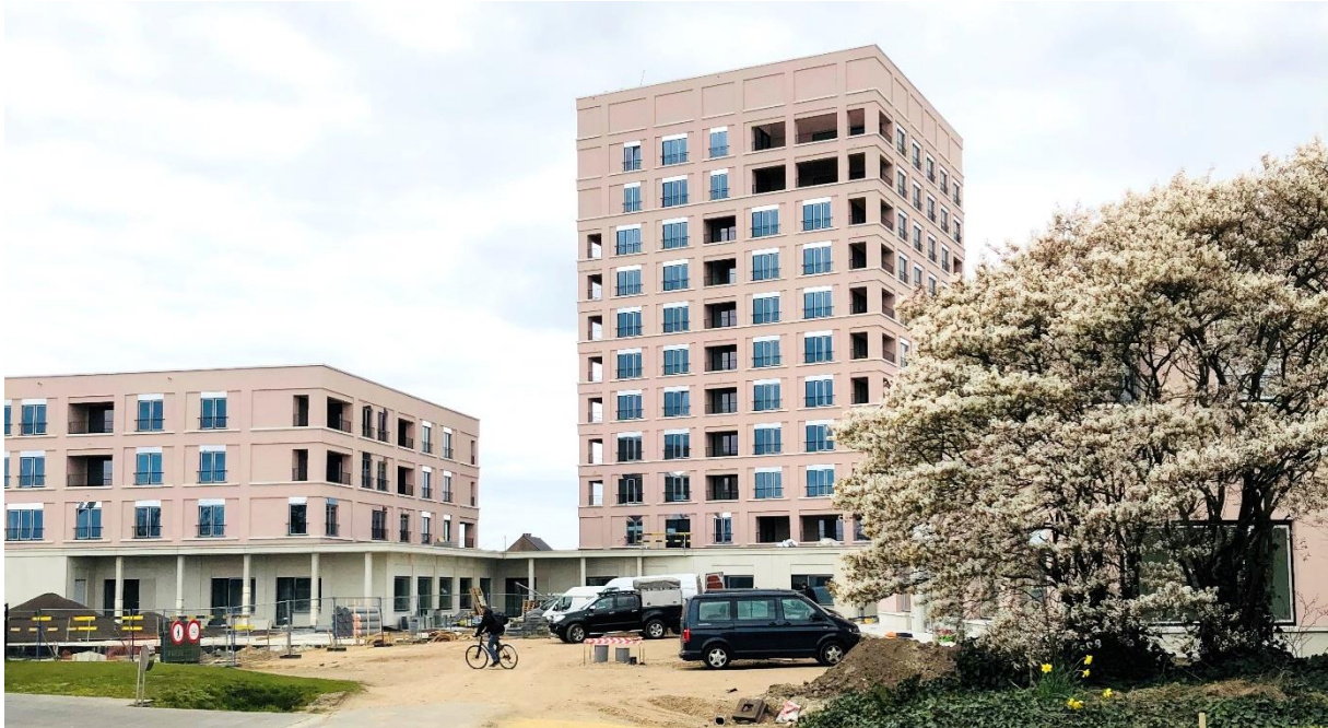
Klein Veldekens – Geel