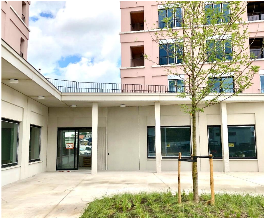
Klein Veldekens – Geel