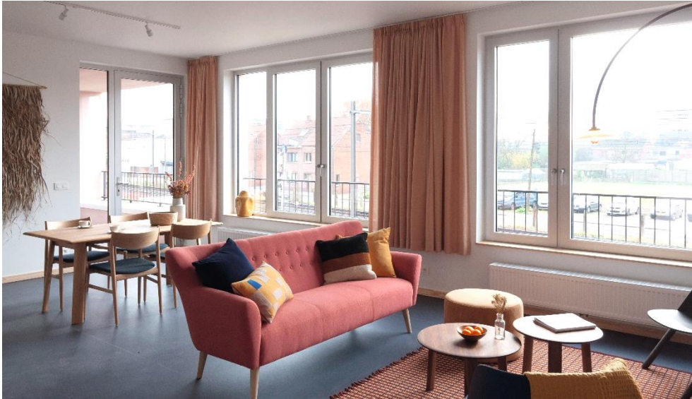
Klein Veldekens – Geel