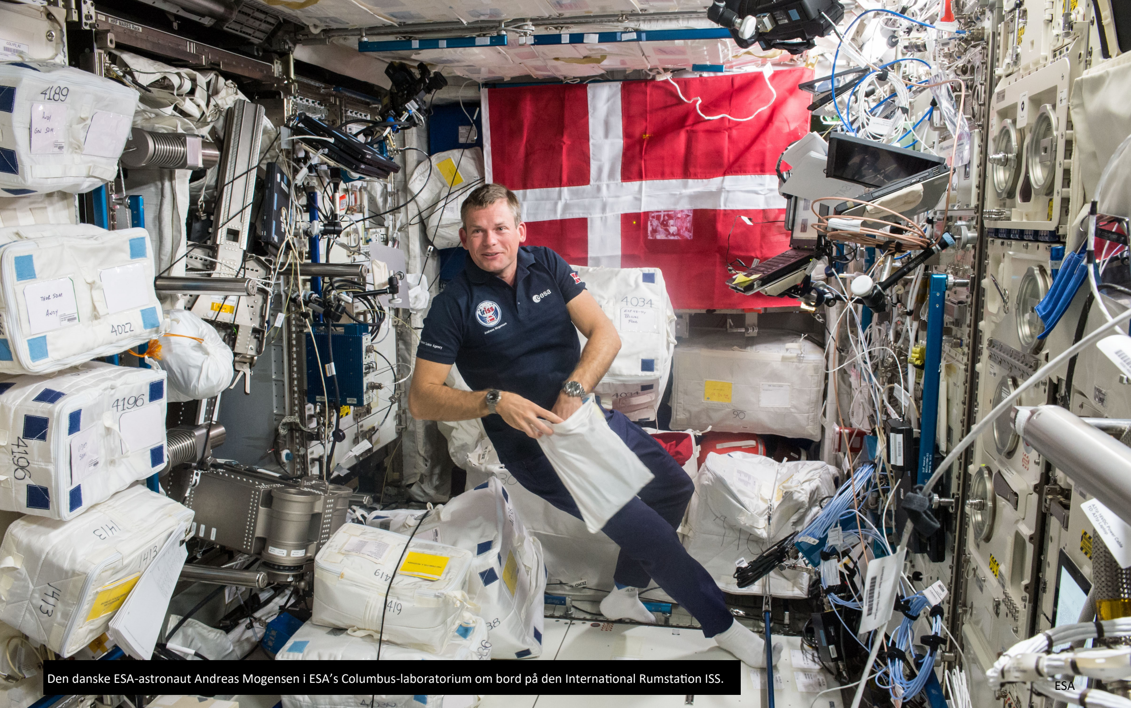
Den danske ESA-astronaut Andreas Mogensen i ESA's Columbus-laboratorium om bord på den Internationale Rumstation ISS.