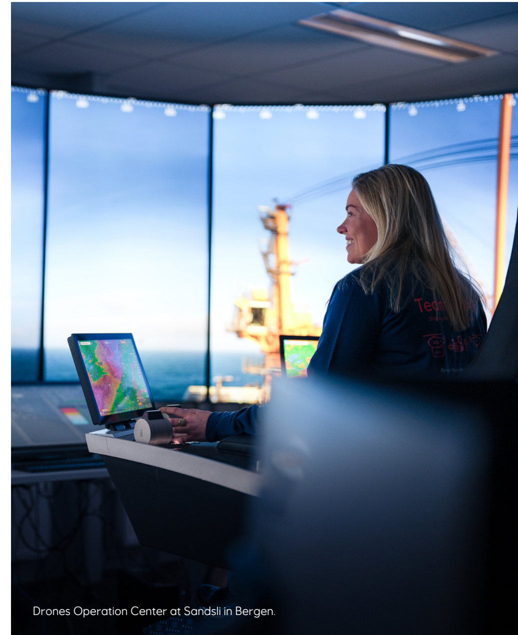
Drones Operation Center at Sandsli in Bergen.