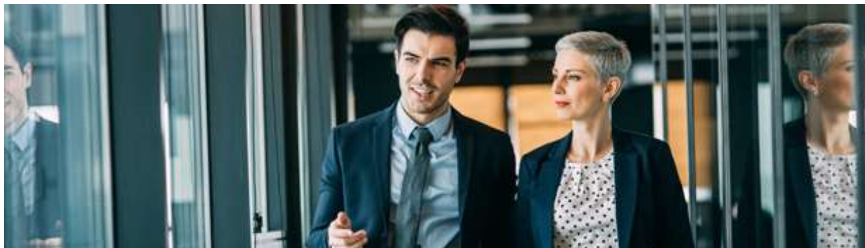
Figur 3: Billede fra marketingmaterialet for de nye lederpakker fra StepStone og Jobindex

Salgsafdelingerne for StepStone og Jobindex bliver slået sammen, men StepStone bevares som en separat eksklusiv jobsite for lederstillinger. Jobannoncerne på StepStone skal fremover sælges sammen med jobannoncerne på Jobindex i en samlet lederpakke til kr. 6.995. Det er inspireret af JobCloud i Schweiz, der har haft succes med at hæve omsætningen ved at slå jobsites sammen og tilbyde samlede pakker, hvor man kan købe to jobannoncer for halvanden jobannonces pris.