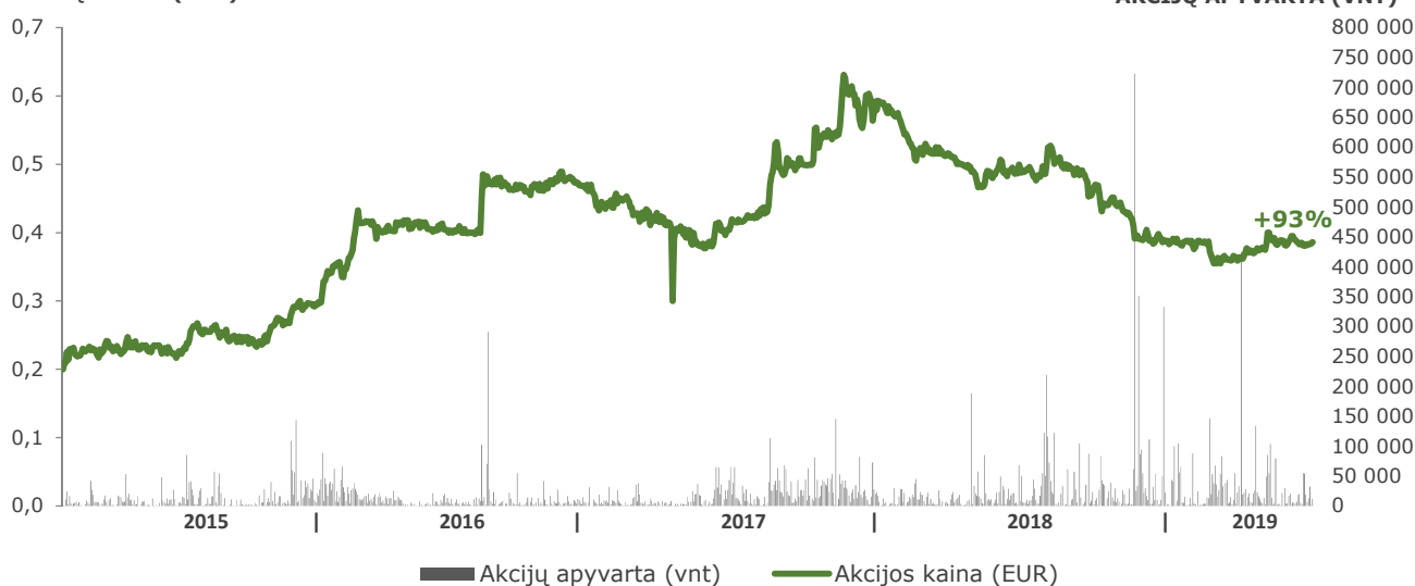
AKCIJŲ APYVARTA (VNT)