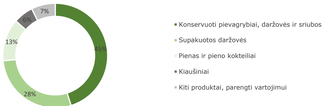
Pajamų struktūra iš galutiniam vartojimui skirtos produkcijos pardavimo (%)

2019 m. pajamų struktūra iš galutiniam vartojimui skirtos produkcijos pardavimo pagal produkto tipą pateikta žemiau esančiame grafike.