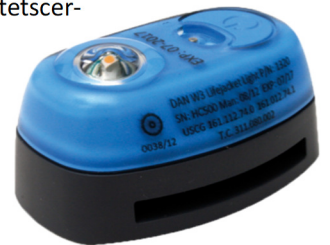
Dan W3, Daniamants mest solgte sikkerhedslys til redningsveste

Markedet for sikkerhedslys til lokalisering af overlevende kan karakteriseres som en nicheforretning inden for redningsudstyrsindustrien. Et vigtigt aspekt af markedet er de forskellige kvalitetscertificeringer og internationale standarder, som er lovkrav. Leverandørerne og kunderne skal være i besiddelse af alle nødvendige godkendelser for både virksomheden og dets produkter, herunder ISO 9001, MED, SOLAS, ATEX, IECEx samt yderligere en række internationale godkendelser. Alle ovennævnte certificeringer skal fornyes løbende.