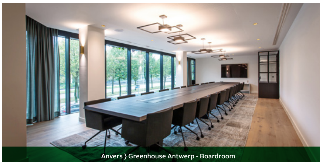
Anvers ) Greenhouse Antwerp - Boardroom

L'ordre du jour complet et tous les documents d'accompagnement de l'assemblée générale sont disponibles le www.interinvest.eu , sous Informations investisseurs/actionnaires/ Assemblées générales .