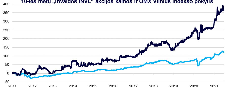
10-ies metų „Invaldos INVL“ akcijos kainos ir OMX Vilnius indekso pokytis