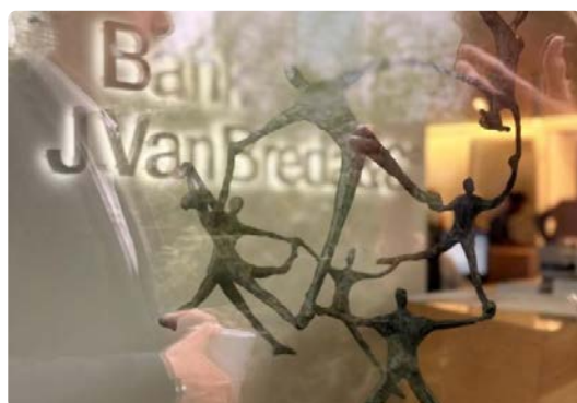
Banque Van Breda