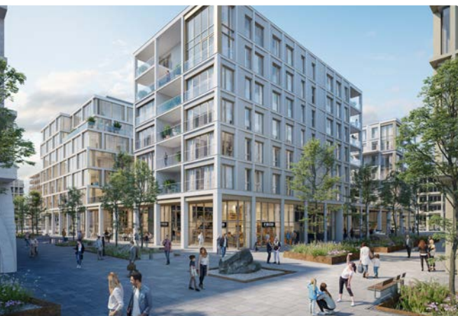
CFE • Immeuble 'Stairs', quartier Cloche d'Or, Luxembourg (image de synthèse)

Multitechnique a enregistré une baisse de 4,5 % de son chiffre d'affaires pour les neuf premiers mois de 2025. Chez VMA, l'activité progresse sensiblement en Building Technologies mais se contracte en Automotive en raison des conditions de marché difficiles que