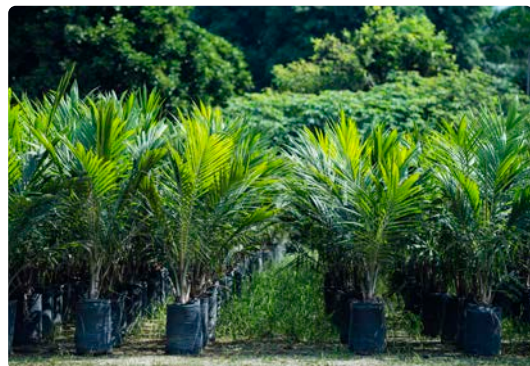
SIPEF • Pépinière de palmiers à huile

ESG. SIPEF a aligné sa méthodologie de comptabilisation des émissions de gaz à effet de serre (GES) et de définition de ses objectifs sur le protocole GES, la norme la plus élevée du secteur. SIPEF a rejoint le High Conservation Value Network (HCVN) ainsi que le Palm Oil Collaboration Group (POCG), qui vise à accélérer la mise en œuvre effective des engagements 'No Deforestation, No Peat Expansion, No Exploitation' (NDPE).