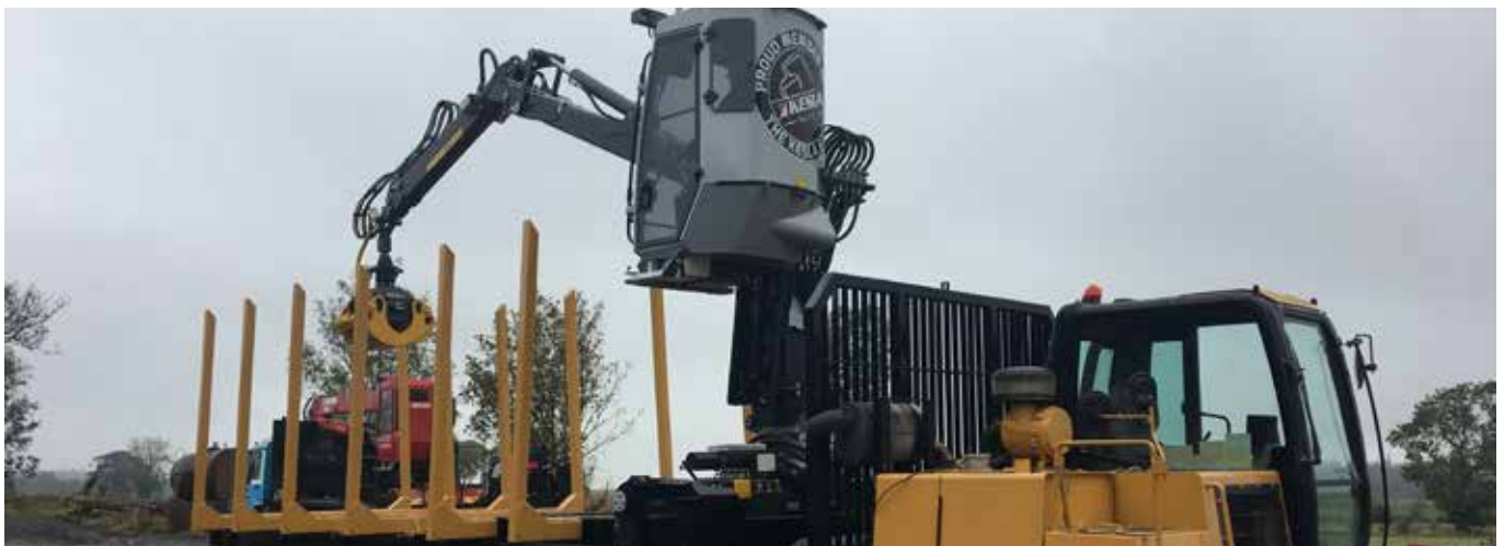
Jälleenmyyjän rakentama yksilöllinen nosturiratkaisu Britteinsaarilla.

Kesla Oyj:n osakkeista ja niiden omistajista pidetään osakasluetteloa Euroclear Finland Oy SIRE- järjestelmässä. Osakkeenomistajaa pyydetään ilmoittamaan osoitteenmuutokset ja muut osakkeen omistukseensa liittyvät asiat siihen arvo-osuusrekisteriin, jossa hänellä on arvo-osuustili.