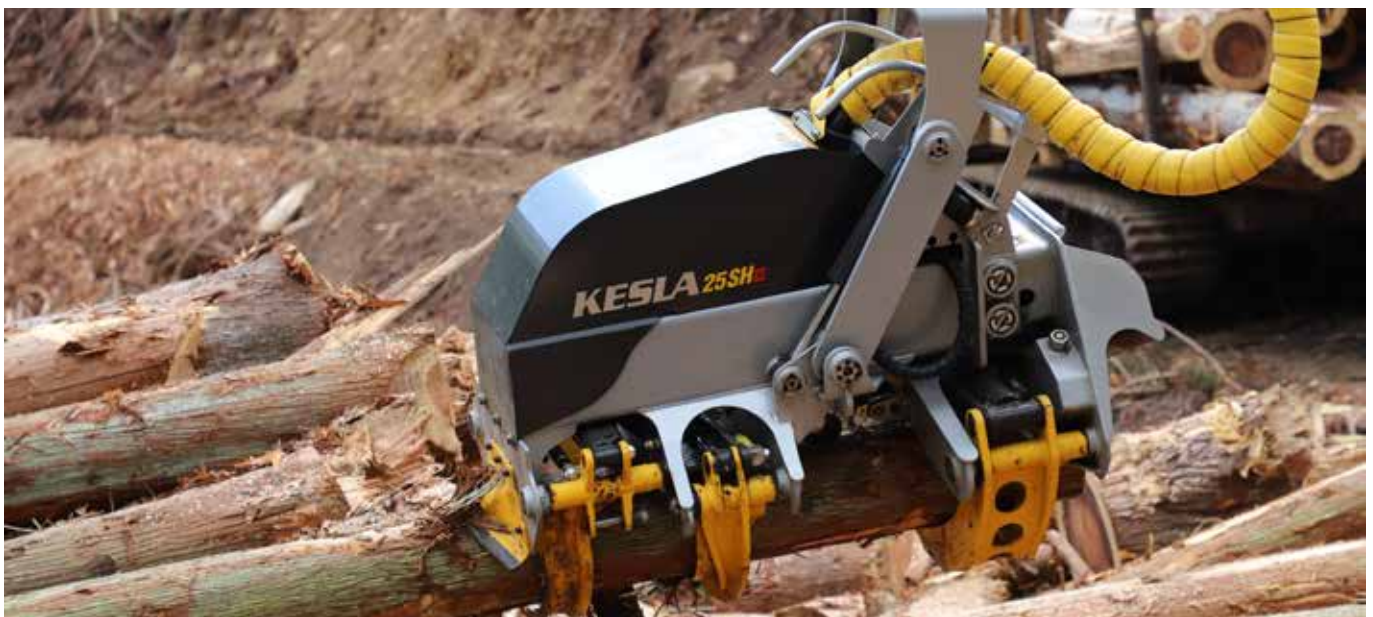
Keslan sykekouria käytetään tyypillisesti kaivinkoneasennettuna mm. Japanissa mm. sugipuun työstöön.

Verot tuloslaskelmassa sisältävät lopetettujen toimintojen verotuottoa 213 tuhatta euroa (66 tuhatta euroa kuluu vuonna 2018).