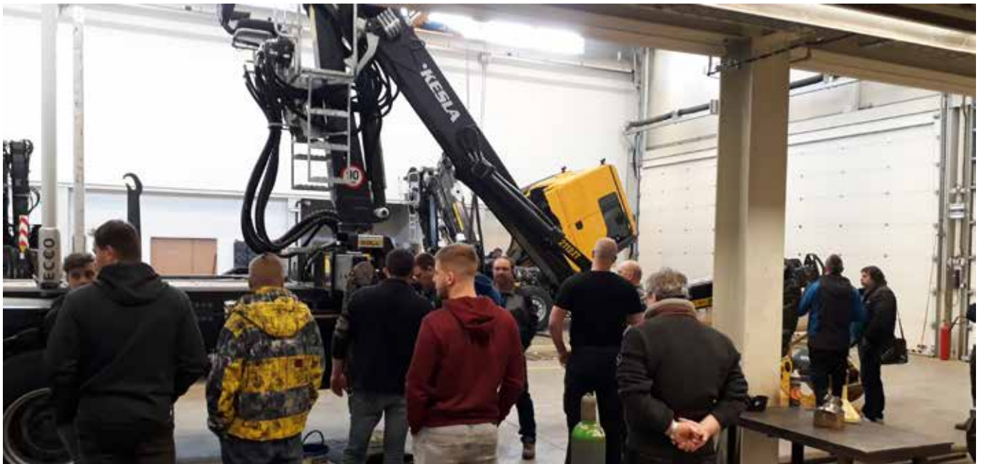
Kesla järjesti vuoden 2019 aikana useita pieniä koulutustapahtumia yhteistyökumppaneilleen. Kuva Venäjältä.

Tehty analyysi osoitti, ettei standardin käyttöönotolla ollut merkittävää vaikutusta yhtiön nykyisiin tulouttamiskäytäntöihin. Yhtiö siirtyi IFRS 15 -standardin käyttöön 1.1.2018 alkaen soveltaen käyttöönotossa täysin takautuvaa menetelmää.