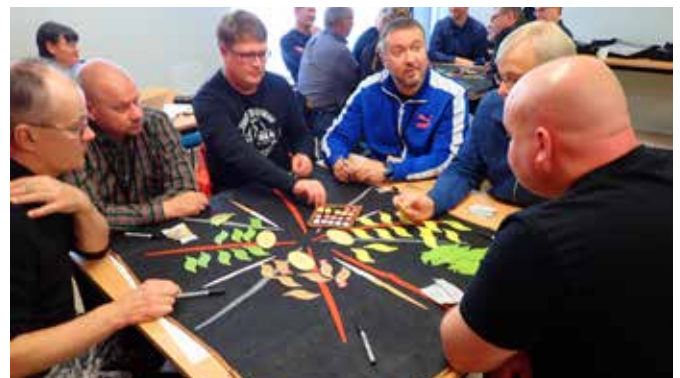
Keslan arvoja käsiteltiin 2019 mm. esimieskoulutuksen työpajoissa, joita pidettiin kaksi.