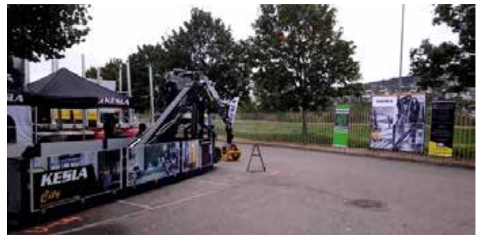
Keslan autonosturit olivat esillä Norjan Transport & Logistikk -messuilla syyskuussa.