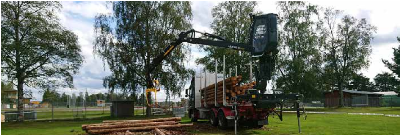
Kesla koeajattui mielenkiintoa herättänyttä proC 2/4 (vipu) + 2 (poljin) -ohjausjärjestelmäänsä Mittia Skogstransport -messuilla Ruotsissa.