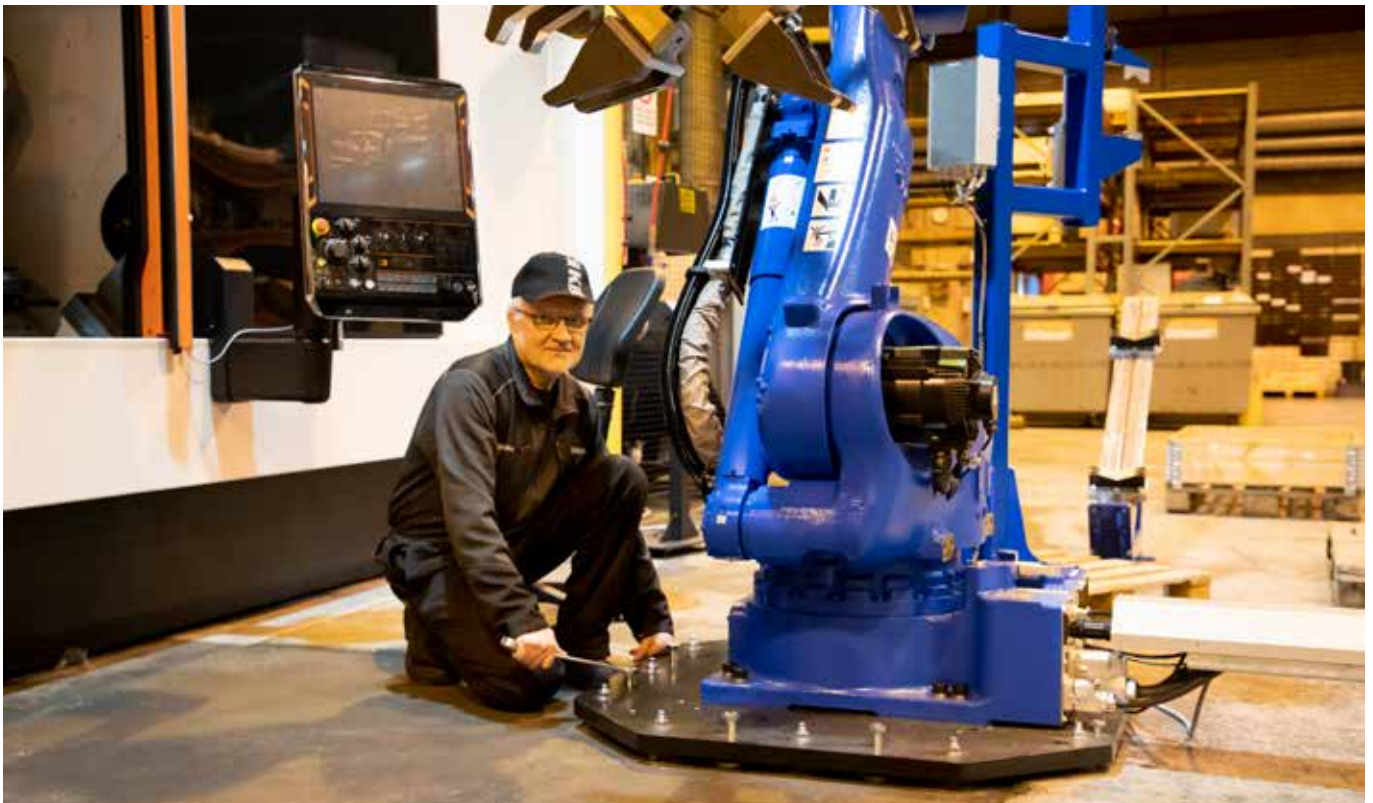
Kesla investoi 2019 mm. Iломantsin tuotantolaitoksen monitoimisorvauskeskukseen, joka asennettiin vuoden loppuun.

Kesla osti MFG Components Oy:n (Tohmajärvi) vuonna 2007 ja fuusioi yhtiön Kesla Components Oy:n (Iломantsi) vuonna 2008. Iломantsin tehdas siirtyi osaksi konsernin emoyhtiö Kesla Oyj:tä 1.7.2016 alkaen konsernin sisäisellä liiketoimintakaupalla, jonka jälkeen MFG Components Oy:n toiminta keskittyi täysin Tohmajärven tehtaalle. Tohmajärvellä yhtiö harjoitti oman valmistustoiminnan ohessa voimansiirtoon liittyvien tuotteiden välityskauppaa tilikauden 2017 kolmannen kvartaalin loppuun, jolloin valmistusliiketoimintaan liittyvä liiketoiminta myytiin liiketoimintakaupalla Kotka Power Tech Oy:lle. 1.10.2017 alkaen yhtiö harjoitti ainoastaan voimansiirron maahantuontiin liittyvää välityskauppaa 30.9.2018 asti. MFG Components Oy:n järjestelyiden jatkumona voimansiirron maahantuonti -liiketoiminta myytiin liiketoimintakaupalla elokuussa 2018 Tools Finland Oy:lle. Lokakuusta 2018 alkaen MFG Components Oy:n liiketoiminta koostui jäljelle jääneen vaihto-omaisuuden realisoinnista, joka saatettiin loppuun kesäkuussa 2019.