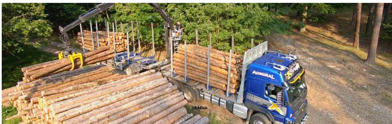
Tsekin autonosturimarkkinat lähtivät vahvaan nousuun.