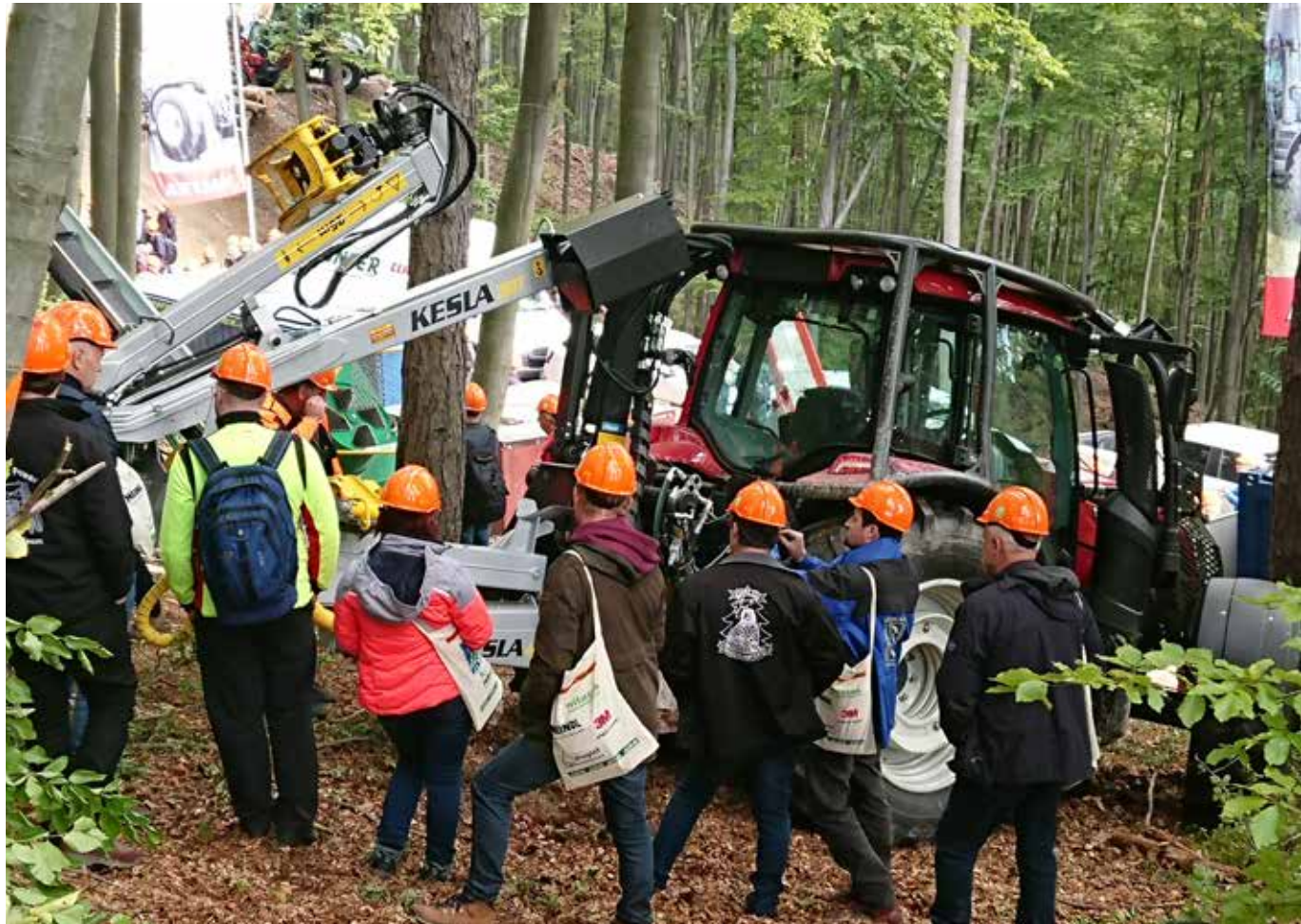
KESLA-tractorivarusteet olivat esillä Astrofomassa Keslan pitkäaikaisen yhteistyökumppanin Land- und Forsttechnik Lunzerin osastolla.

Yhtiöllä ei ole ollut valuutanvaihtosopimuksia tilikausilla 2019 ja 2018.