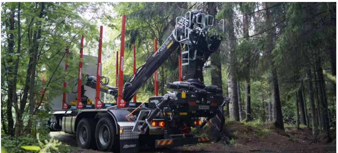
KESLA 2009ST-autonosturi on Venäjän myydyimpiä malleja.

Kesla Oyj siirtyi vuoden 2005 alusta IFRS-periaatteiden mukaiseen tilinpäätöskäytäntöön. Avaava tase 1.1.2004 laadittiin Kesla Oyj:n tasolla. Tilinpäätös vuodelta 2005 on ensimmäinen IFRS-periaatteen mukaisesti laadittu konsernitilinpäätös. Ennen IFRS-standardien käyttöönottoa Keslan tilinpäätökset on laadittu suomalaisen tilinpäätösnormiston (FAS) mukaisesti.