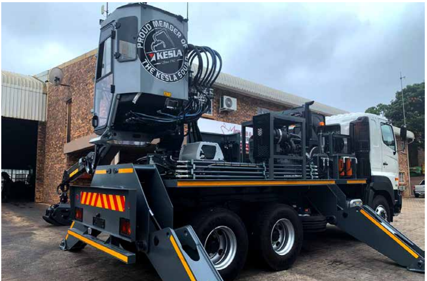
Tämä asiakasräätälöity nosturiratkaisu Etelä-Afrikassa.