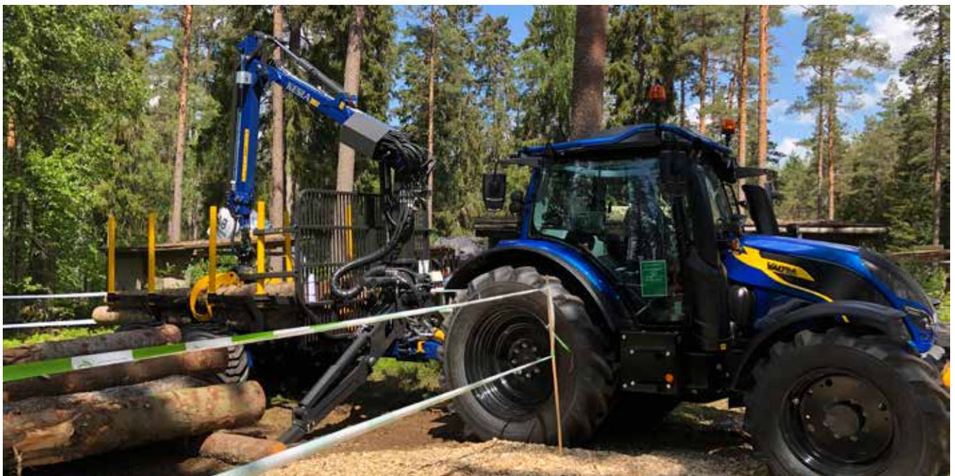
Elmia-messut Ruotsissa olivat vahvat messut traktorivarusteille. Kuva Keslan yhteistyökumppanin Lantmännenin osastolta.

Yhtiöjärjestyksen mukaan A-lajin osakkeille maksettava osinko voi olla kaksinkertainen B-lajin osakkeille maksettavaan osinkoon verrattuna.