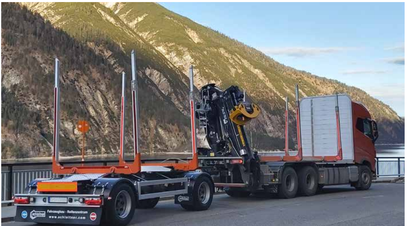
Z-nosturit ovat kasvattaneet suosiotaan eri puolilla maailmaa. Kuvan Z-nosturi on Saksasta.

Olemme ottaneet tilintarkastuksessa huomioon riskin siitä, että johto sivuuttaa kontroleja. Tähän on sisällynyt arviointi siitä, onko viitteitä sellaisesta johdon tarkoitushakuisesta suhtautumisesta, josta aiheutuu väärinkäytöksestä johtuvan olennaisen virheellisuuden riski.