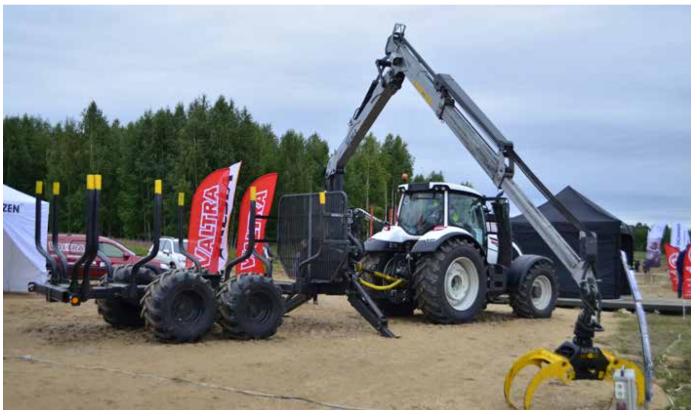
Venäjän Lesorub-näyttelyssä esillä oli myös KESLA-Valtra-yhdistelmä.