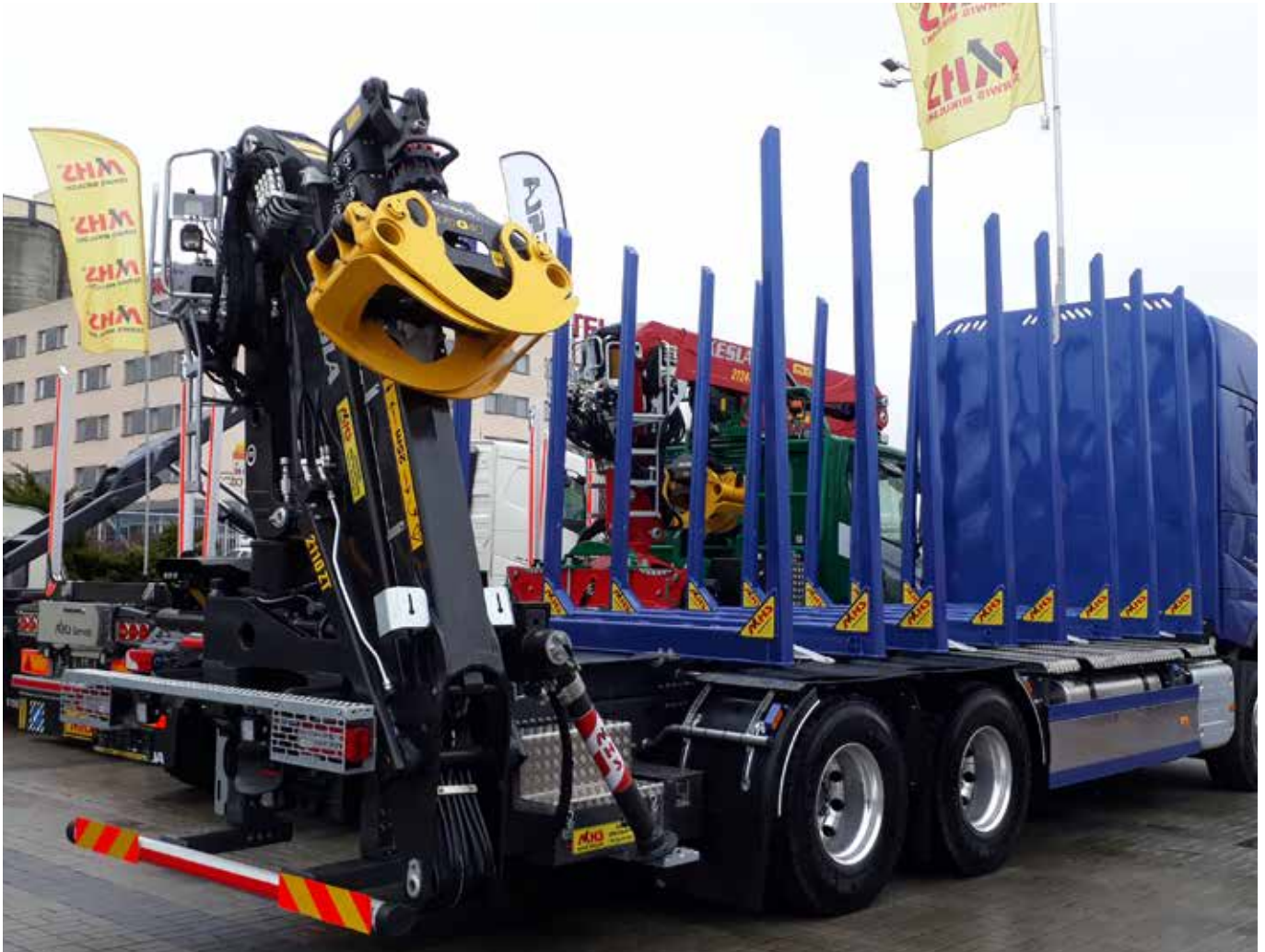
KESLA-autonosturit esillä Puolan messuilla pitkäaikaisen yhteistyökumppanimme MHS:n osastolla.

Tällä hetkellä IASB ei ole julkistanut uusia standardeja ja tulkintoja, joilla olisi merkittävää vaikutusta konsernin 1.1.2020 alkavaan tilikauteen