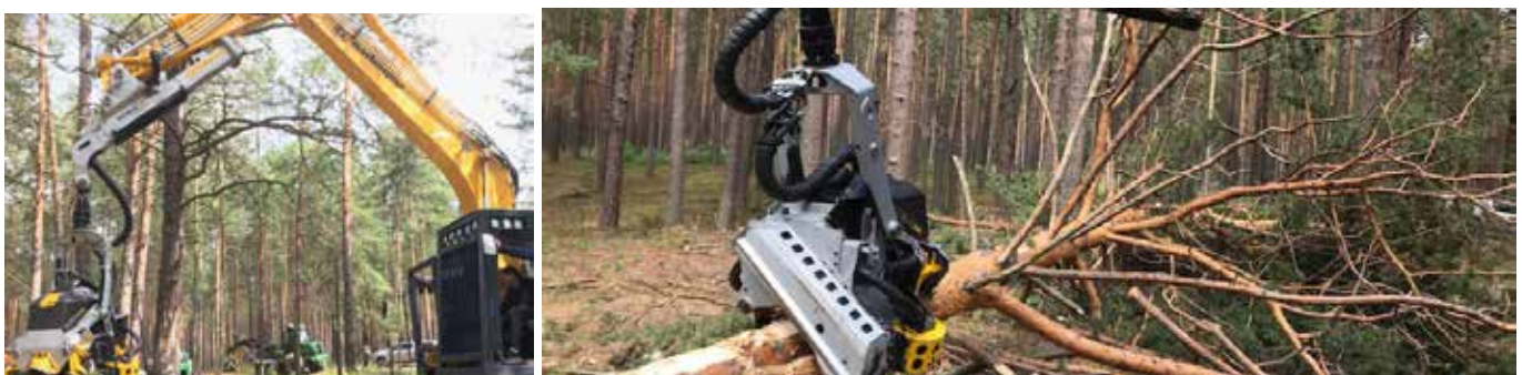
Keslan pitkäaikainen yhteistyökumppani valkovenäläinen Amkodor esitteli Venäjällä kaivuriharvesteriaan.

Ostovelat ja muut velat sisältävät lopetettujen toimintojen osuutta 3 tuhatta vuonna 2019 (15 tuhatta vuonna 2018).