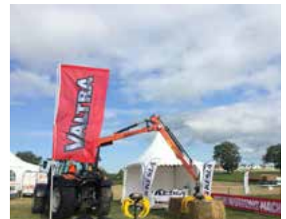
Kuva Ranskan Grass Fair -messuilta, jossa Keslalla ja Valtralla oli osin yhteinen osasto.