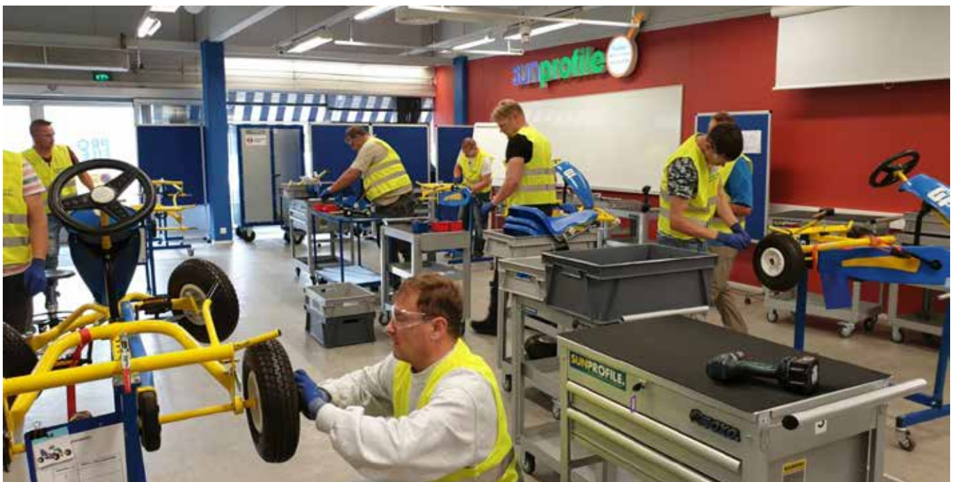
Kesla aikoo hyödyntää Lean-menetelmiä entistä tehokkaammin eri toiminnoissa. Kuva eräästä vuoden 2019 Lean-koulutuksesta.