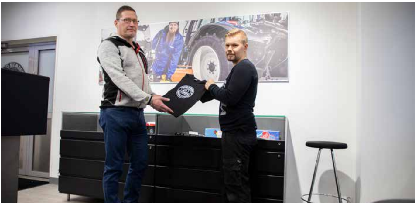
Keslan varaosamyymälässä esillä on muutakin kuin varaosia.

Tunnuslukujen laskentaperiaatteissa ei ole tapahtunut muutosta lukuun ottamatta investointien vaihtoehtoisia tunnuslukuja, jotka sisältävät IFRS 16 -vuokrasopimusten vaikutukset.