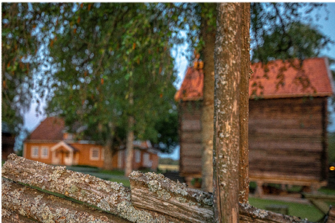
Gamle Hvam